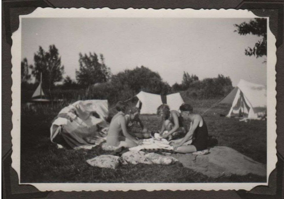
Kamp te Loosdrecht (1933)

Men ging naar Loosdrecht, het Landje Diem, de Muidertrekvaart op, en een enkele keer de sluis door naar Durgerdam, naar de Zuid-Hollandse meren, over de Vecht, de Gouzee. Het waren vaarvakanties inclusief kamperen.