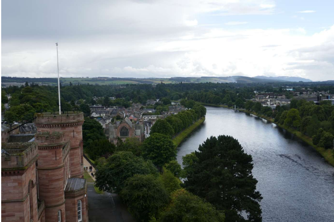
Inverness, rechts de rivier de Ness

's Middag ben ik tussen de buien door naar het centrum van Inverness gefietst. In het museum werd interessante informatie gegeven over de geschiedenis van Schotland en de talen die er gesproken worden. Dat is nu hoofdzakelijk Engels, maar in de Schotse Hooglanden wordt ook nog het met het Iers verwante Gaelic gesproken. Alle straatnaamborden en wegwijzers in Inverness waren tweetalig.