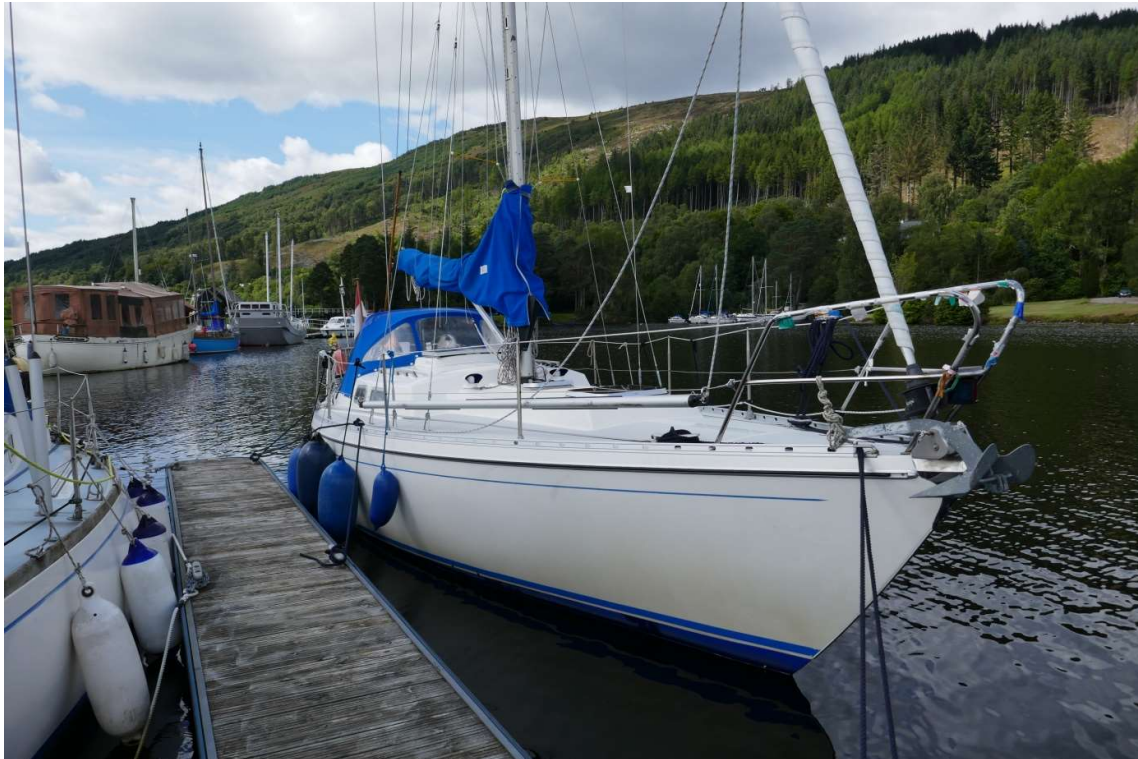
Aangemeerd in Gairloch

uit naar de ingang van Loch Lochy, het laatste van de drie Lochs die deel uitmaken van het Caledonisch Kanaal. Het was wat groter dan Loch Oich, maar kleiner dan Loch Ness. Mijn bestemming was het gehuchtje Gairloch, helemaal aan de zuidoostpunt van het meer. Onderweg kwam ik het jacht uit Delfzijl tegen waar ik in Fort Augustus naast had gelegen. Het was nu op de terugweg.