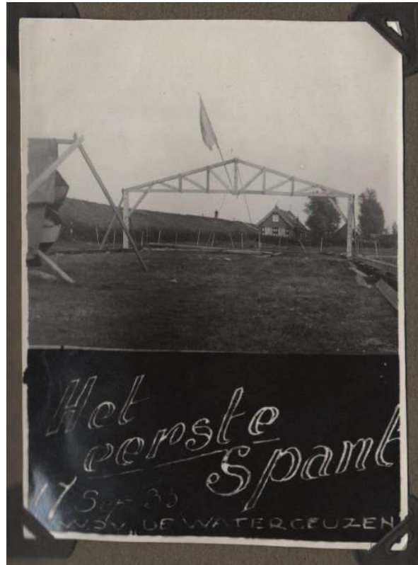
De loods: het eerste spant (17 sept. 1933)