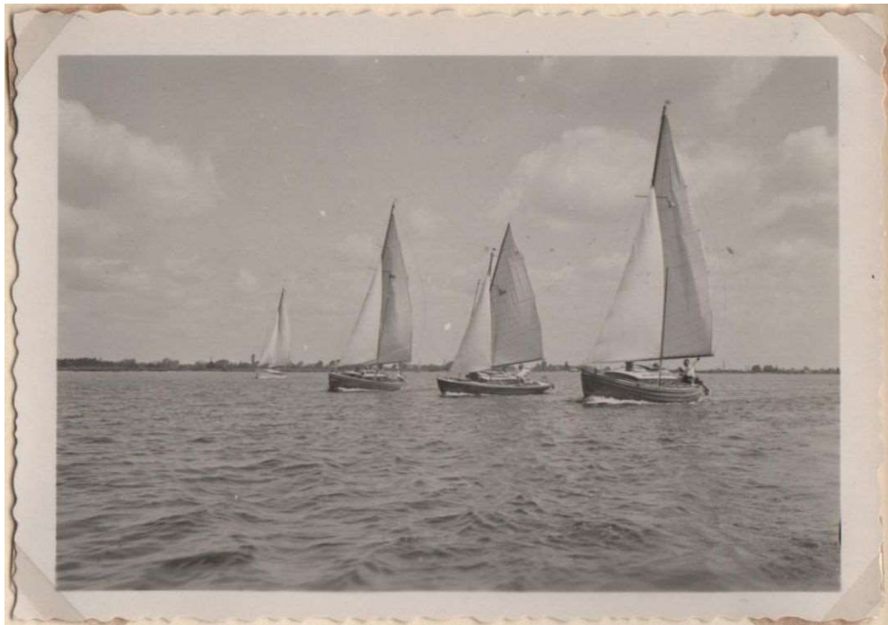
Viking, Bliksem en Njord op de Westeinder (1949)