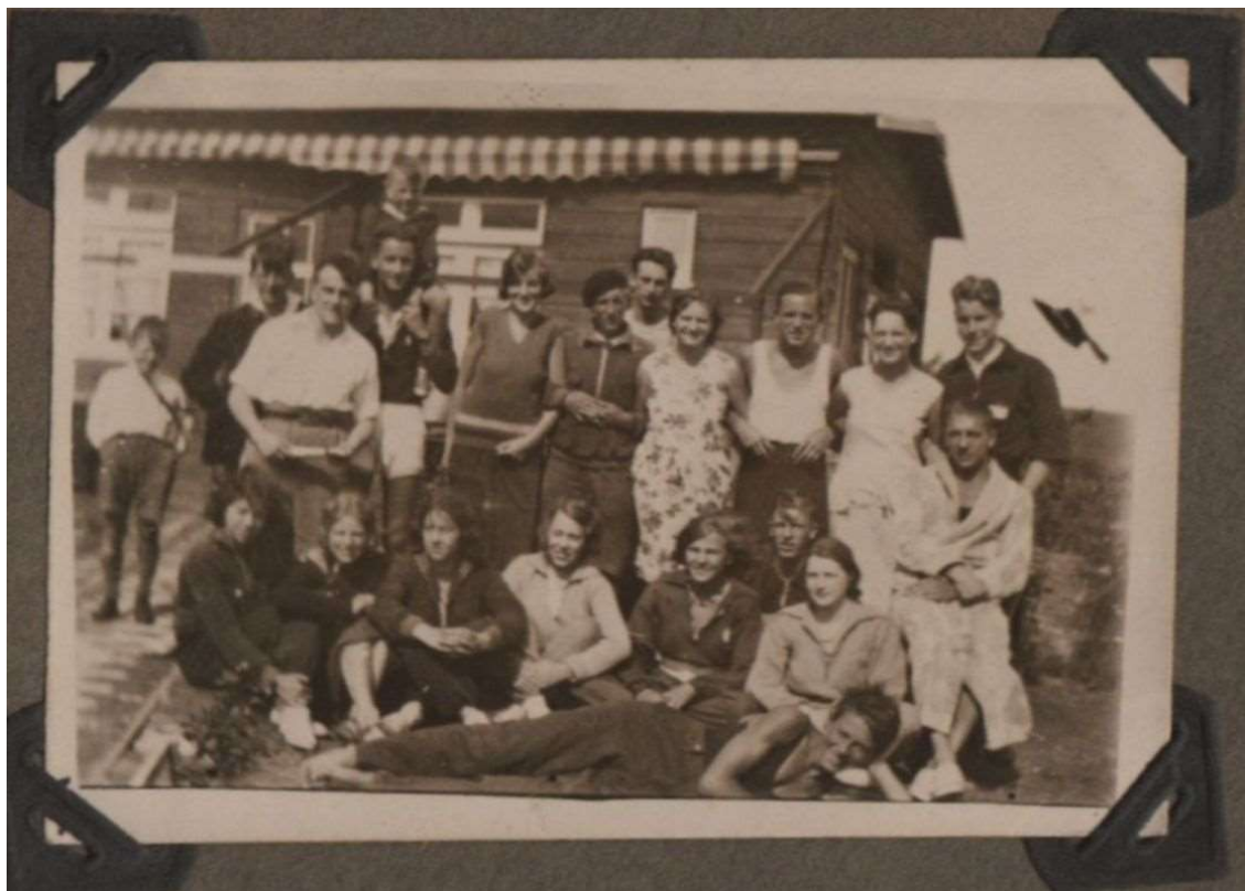
Het eerste clubhuis