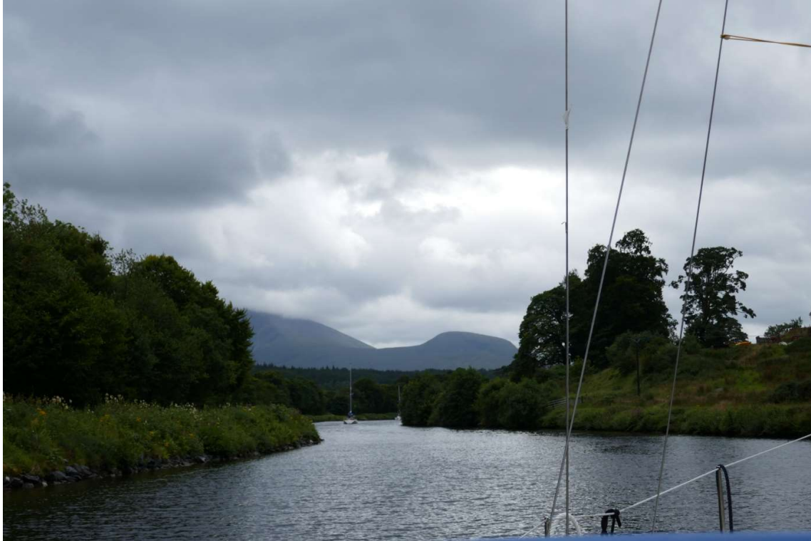
Caledonisch Kanaal. Op weg naar Banavie