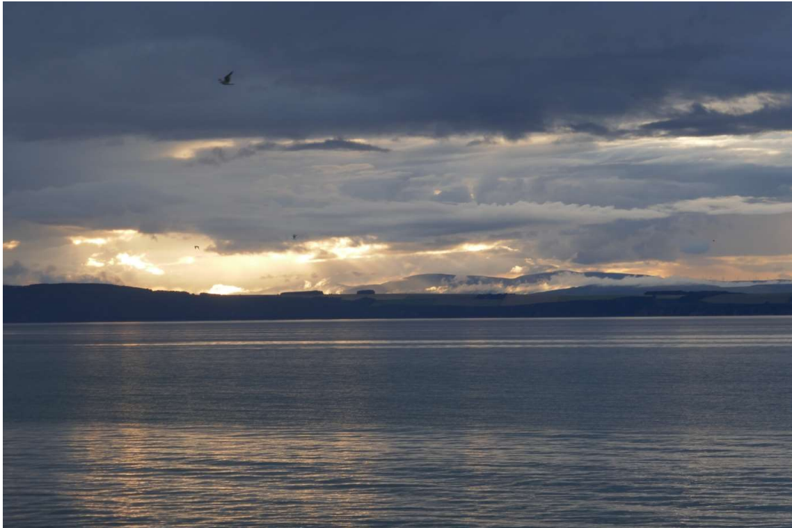
Avondstemming aan de Moray Firth bij Nairn

op weg was naar een grote natuurlijke haven tegenover Nairn. Veel inwoners van het plaatsje stonden ernaar te kijken.