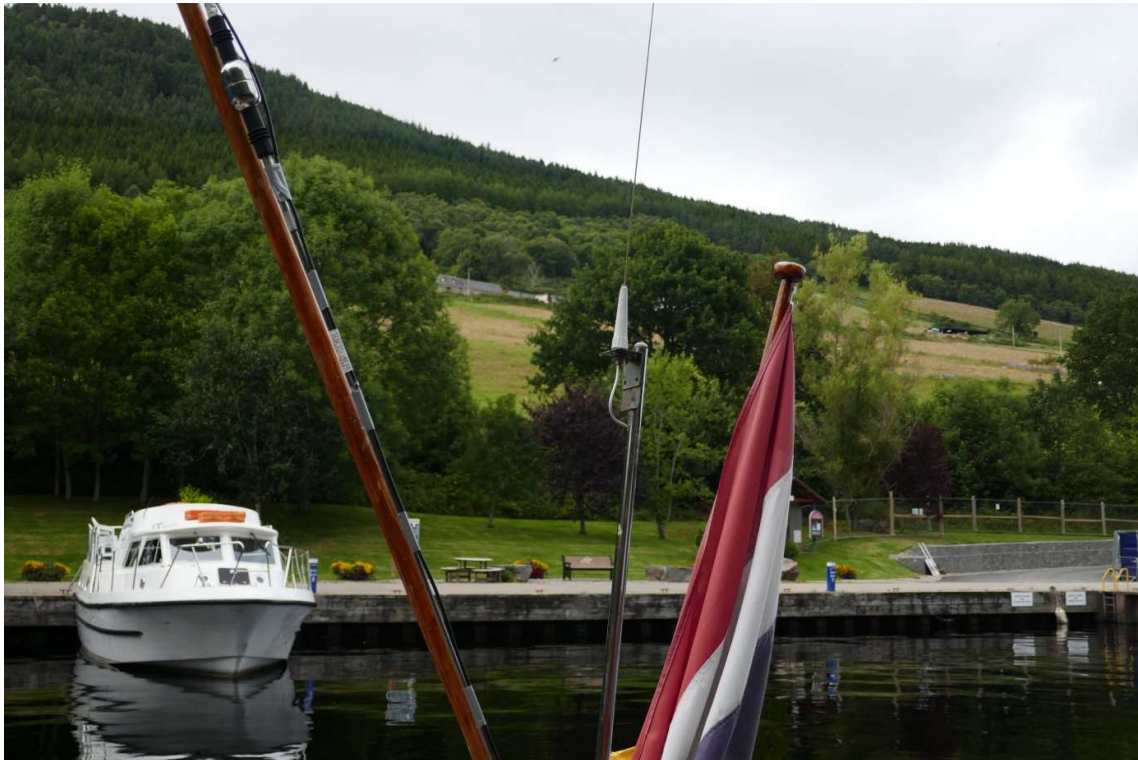
Uitzicht in het eerste haventje aan het Loch Ness

Aan het eind van de middag draaide ik het haventje in. Er lagen alleen een paar huurmotorkruisers en het werd ook gebruikt als opstapplaats voor rondvaarten. Nadat ik lekker buiten had gegeten, heb ik een mooie wandeling gemaakt over de berghelling waar ik vanuit de kuip een schitterend uitzicht op had. Gerstvelden, stukjes bos en weilanden waar schapen graasden wisselden elkaar af en ik had een schitterend uitzicht over Loch Ness. Ik waande me helemaal alleen, maar op de terugweg kwam ik een jongen en een meisje tegen met een enorme bepakking, die bij een open plek wat zoekend rondkeken. Toen we elkaar passeerden kwam de jongen naar me toe en vroeg me bedeesd of ze hier hun tent zouden mogen opzetten. Ik wist natuurlijk net zoveel als zij, maar de plek hoorde bij het pad en was dus geen privéterrein, het was er vlak en het uitzicht over het meer was fantastisch, dus waar kon je beter kamperen dan hier? Ik wenste het stel nog een prettige avond en een goede nacht toe en vervolgde mijn afdaling. De volgende dag had ik wel met ze te doen. Het was grijs en nevelig, het regende gestaag en dat ging zo de hele dag door. In plaats van naar de kasteelruïne te fietsen ben ik aan boord gebleven en heb me onder de inspirerende klanken van Mozart hoofdzakelijk bezig gehouden met het schrijven van mijn reisverslag voor het thuisfront. Toen de temperatuur onder de 16 graden dreigde te zakken heb ik de kachel aangezet. Gelukkig was er walstroom.