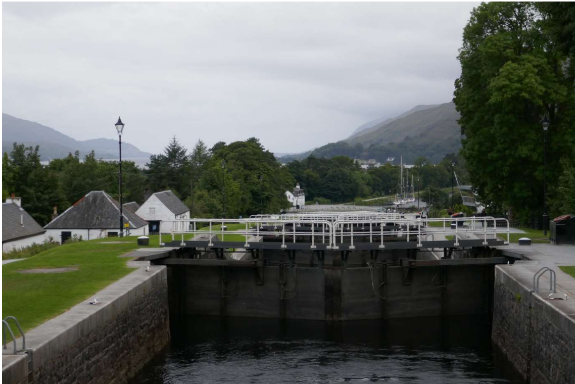
De sluis bij Banavie, de langste trapsluis van het Caledonisch Kanaal

Toen ik 's avonds het vervolg van mijn tocht wilde voorbereiden, deed ik de onaangename ontdekking dat ik een kaart miste van het eerste stuk van de route. De verkoper van de kaartenhandel in Amsterdam had me verzekerd dat de kaart van de kust en eilanden ten westen van Glasgow aansloot op de kaart van het Caledonisch Kanaal, maar dat bleek niet het geval te zijn. Hij hoorde dat natuurlijk te weten, maar ik had al gemerkt dat je goed moest controleren wat hij leverde. Het jaar ervoor had ik bij hem kaarten van de Westelijke en de Oostelijke Waddenzee gekocht, althans dat dacht ik. Toen ik op de boot het pakpapier had verwijderd bleken het kaarten van de Wester- en de Oosterschelde te zijn. De ontbrekende kaart was in Banavie niet te koop maar in de eerstvolgende haven na het Caledonisch Kanaal was een watersportzaak waar ze hem wellicht verkochten. De sluiswachter adviseerde me om aan zijn collega bij de laatste sluis, waar ik de sleutel van de sanitaire voorzieningen moest inleveren, te vragen of hij een uitdraai kon maken van het ontbrekende kaartgebied