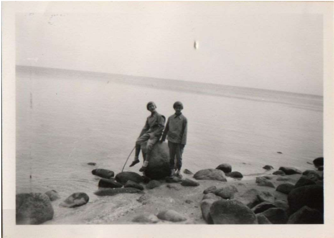
Onderaan de Diemerzeedijk