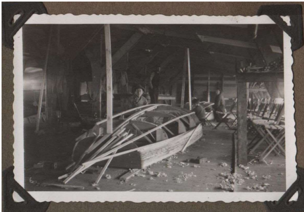
Een van de eerste zelfbouwboten

Wat voor boten lagen er nu zoal in het haventje? Nou, niet veel witte boten, zoals nu. Veel hout.