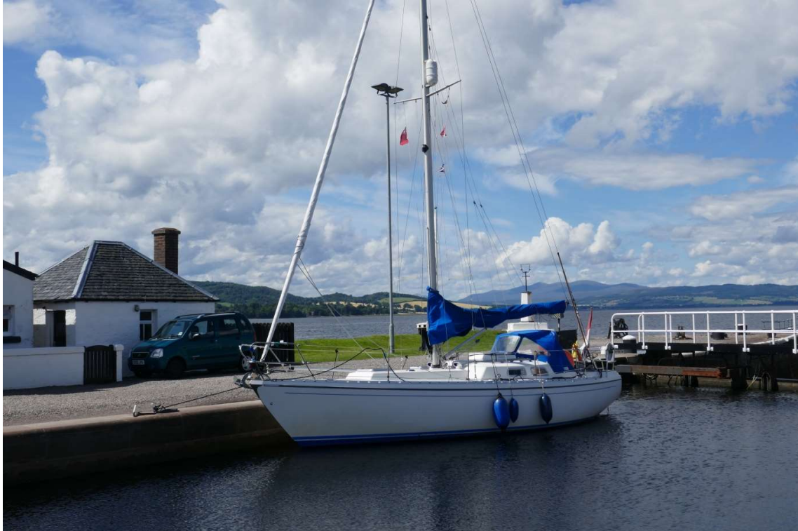
In de zeesluis bij Inverness, de eerste sluis van het Caledonisch Kanaal

Ik heb snel de motor gestart en een kwartier later was ik bij de sluis. De deuren stonden al open en de sluiswachter stond me al op te wachten. In het Caledonisch kanaal zitten 28 sluisen en in deze sluis kon ik zien hoe het schutten in zijn werk ging. In ieder geval heel anders dan in een Nederlandse sluis. Daar gooi je je lijnen om muurbolders, hier stonden alleen bolders op de wal, en die lag ruim drie meter boven het schip. In Zweden had ik in het Götakanaal bijna hetzelfde meegemaakt, daar was de wal nog veel hoger en moest er eerst een bemanningslid de wal op met de lijnen in zijn hand. Hier moest ik mijn lijnen naar de sluiswachter gooien. Lassowerpen is nooit mijn sterkste punt geweest en bij de eerste worp ging het dan ook mis, maar de tweede poging had wel succes en toen ik na de achterlijn ook de voorlijn drie meter omhoog slingerde had de sluiswachter hem direct te pakken. De lijnen werden niet aan de bolders vastgemaakt, zoals in Zweden, maar er omheen gelegd en dan weer terug gegooid. Na het werpen volgde dus het vangen. Omdat je natuurlijk snel geneigd bent om vooral bij het vangen een stap voor- of achteruit te zetten, moet je uitkijken dat je niet op een plaats staat waar je gemakkelijk af kunt duikelen.