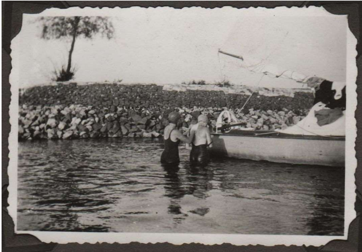
Wasdag in de Rijn (1934)

Ook werd er via de Rijn naar Arnhem gevaren. En de Grebbeberg. Er werd onderweg gekampeerd en de was werd gewoon staand in de Rijn gedaan.