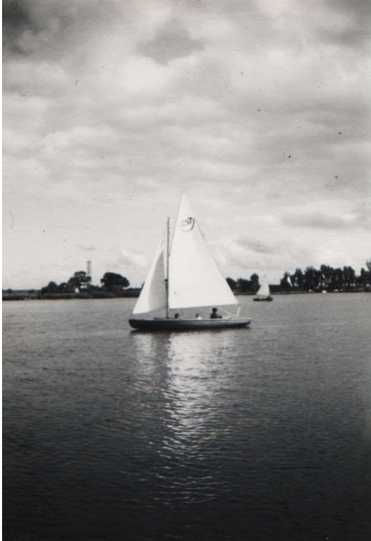
16 kwadraat M