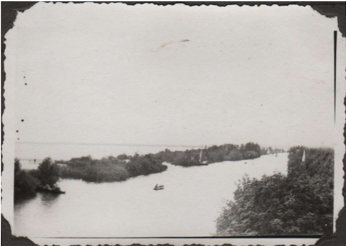
Uitzicht vanuit het torentje op het Merwedekanaal

Het begint met prachtige foto's uit de jaren dertig. Op het haventje aan de Diemerzeedijk te Amsterdam stond toen een houten torentje met daarop een vlaggenmast. Vanaf dat torentje werd bij gelegenheid het startsein gegeven voor wedstrijden. Als je er bovenop stond had je een mooi uitzicht op het Merwedekanaal. Tegenwoordig kijk je naar het Amsterdam-Rijnkanaal met de brug van de A2.