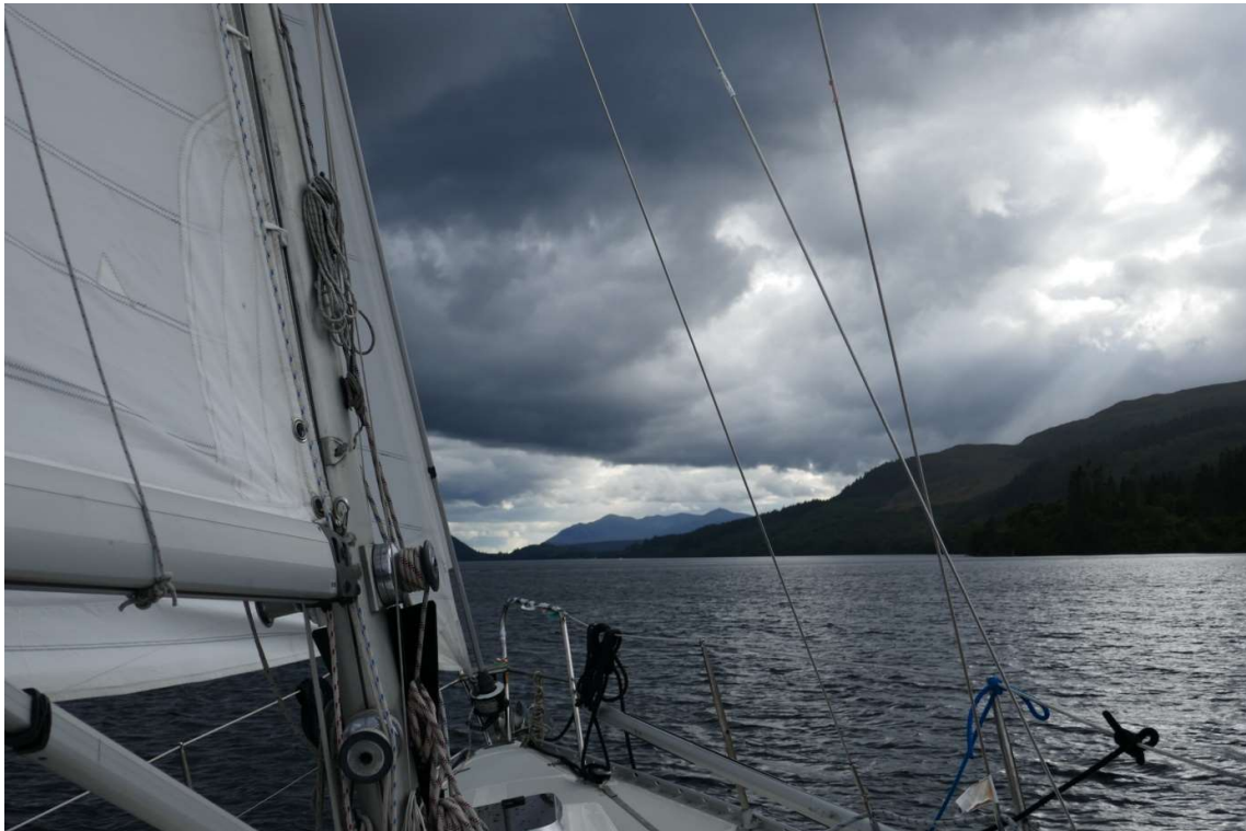
Loch Ness, er trekt een bui over en ik kan even zeilen

zo dicht mogelijk langs gevaren. Loch Ness is kaarsrecht en omdat het aan beide kanten bergwanden heeft lijkt het veel op de fjorden aan de Noorse westkust. Alleen zijn de wanden daar in het algemeen steiler en hoger. Omdat het heel diep is, op veel plekken meer dan 220 meter, is ankeren er bijna niet mogelijk. Net al twee dagen ervoor had ik de motor nodig, omdat de wind pal tegen en ook te zwak was om te kunnen zeilen. Maar toen er wat buiige bewolking aankwam, draaide de wind wat en nam hij ook flink toe, zodat ik even kon zeilen. Langer dan een half uur duurde het helaas niet.