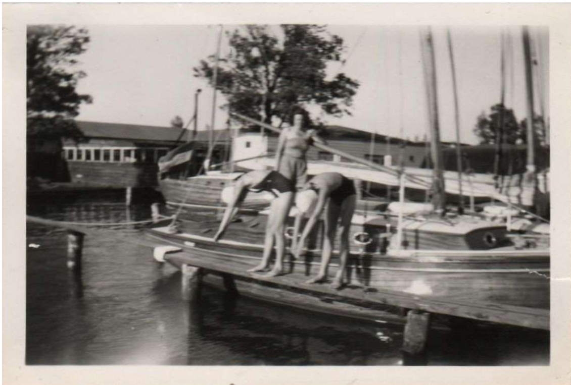
Zwemmen in de haven