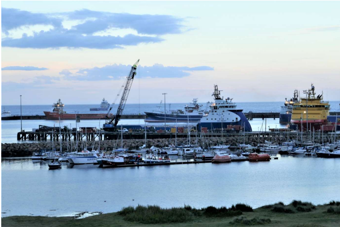
Haven van Peterhead

wilde rondzeilen. Het leek me een vrij optimistisch ingeschatte race tegen de klok die ik ze in ieder geval niet na wilde doen.