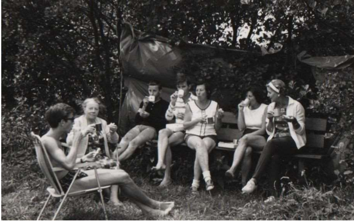
Unieterrein Vinkeveen. (1958)