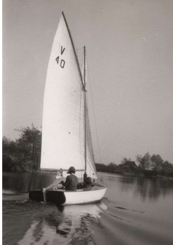
V40 De Vrijheid (Loosdrecht, 1962)

Veel kinderen hadden een Optimistje, een aantal vaders bouwden die zelf. De kinderen van Els en Sietse hadden er ook één, maar wel gekocht. Op een goed moment gingen de twee gezinnen in Durgerdam liggen met hun boten. Ook daar was veel gezelligheid.