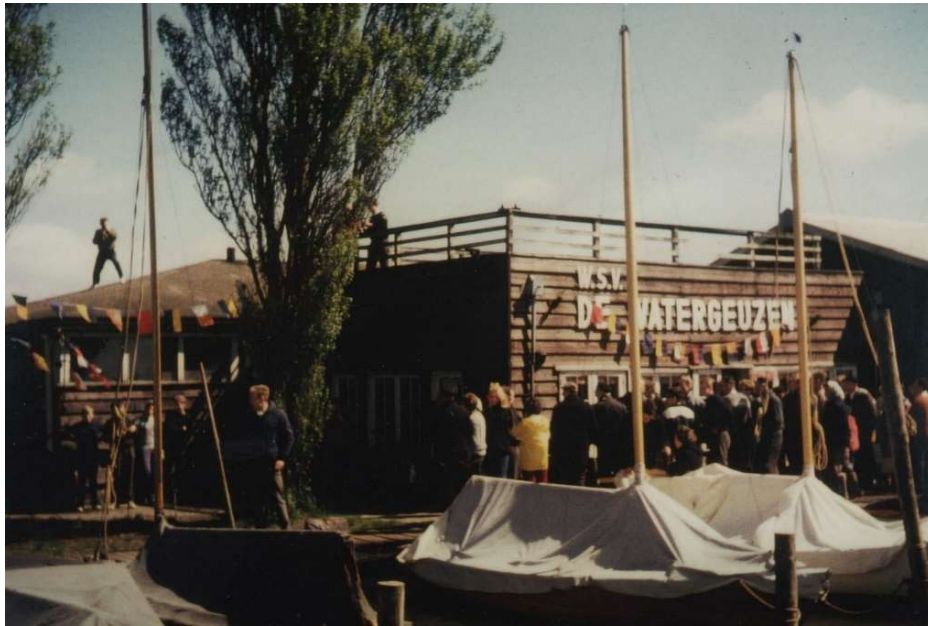
Clubhuis met dakterras