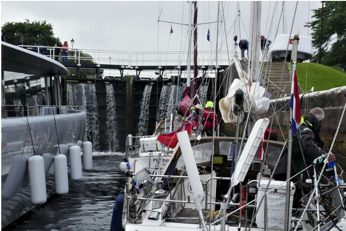
In de eerste trapsluis. De voorbuurman uit Delfzijl houdt mijn preekstoel vast terwijl hij nauwlettend zijn lijnen en willen in de gaten houdt.

Ik ging als laatste de sluis in en moest een beetje schuin liggen, anders zouden mijn vlaggenstok en AIS-antenne gekraakt worden. Om te verhinderen dat ik zijn zelfstuurvaan zou raken, hield de buurman van het schip uit Delfzijl mijn preekstoel vast. Zo ging het in iedere kolk. Het gooien van de lijnen naar de sluiswachters lukte nu veel beter dan de in de eerste twee sluisen. Na een uur was de schutting voorbij en kon ik de oevers waar ik de vorige dag had gefietst vanaf het water bekijken. Het uitzicht was mooier omdat ik nu over de bomen kon kijken en daardoor beter de heuvels kon zien aan de noordkant van het kanaal. Aan de andere kant lagen meestal vrij hoog oplopende berghellingen. Er volgde nog een brug met direct daarna weer een sluis en na een paar kilometer passeerde ik de laatste sluis voor Loch Ness.