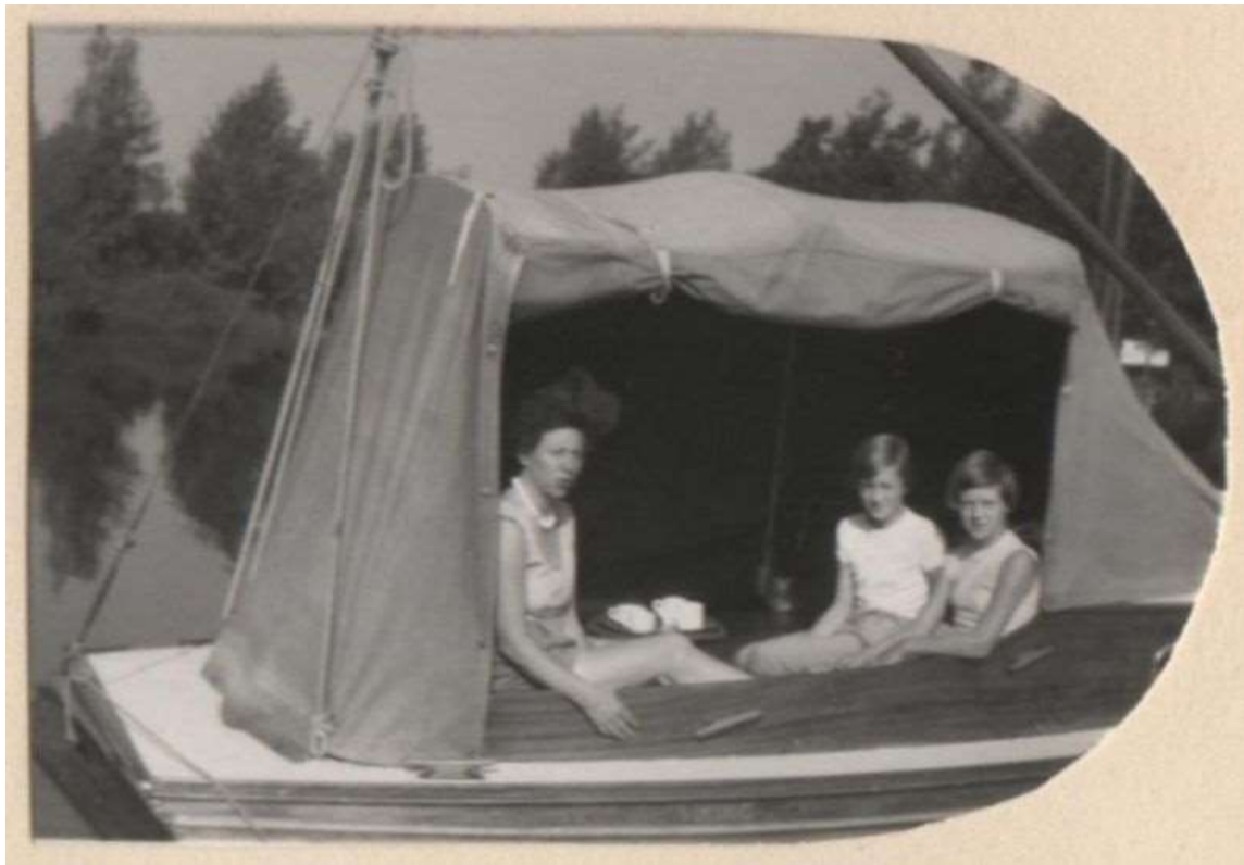
Viking met tent

Maar die drie weken, dat was nog niet alles. De boot werd daarna in Loosdrecht neergelegd en daar verbleef het gezin dan de rest van de schoolvakantie, en vader, die weer aan het werk moest, fietste heen en weer.