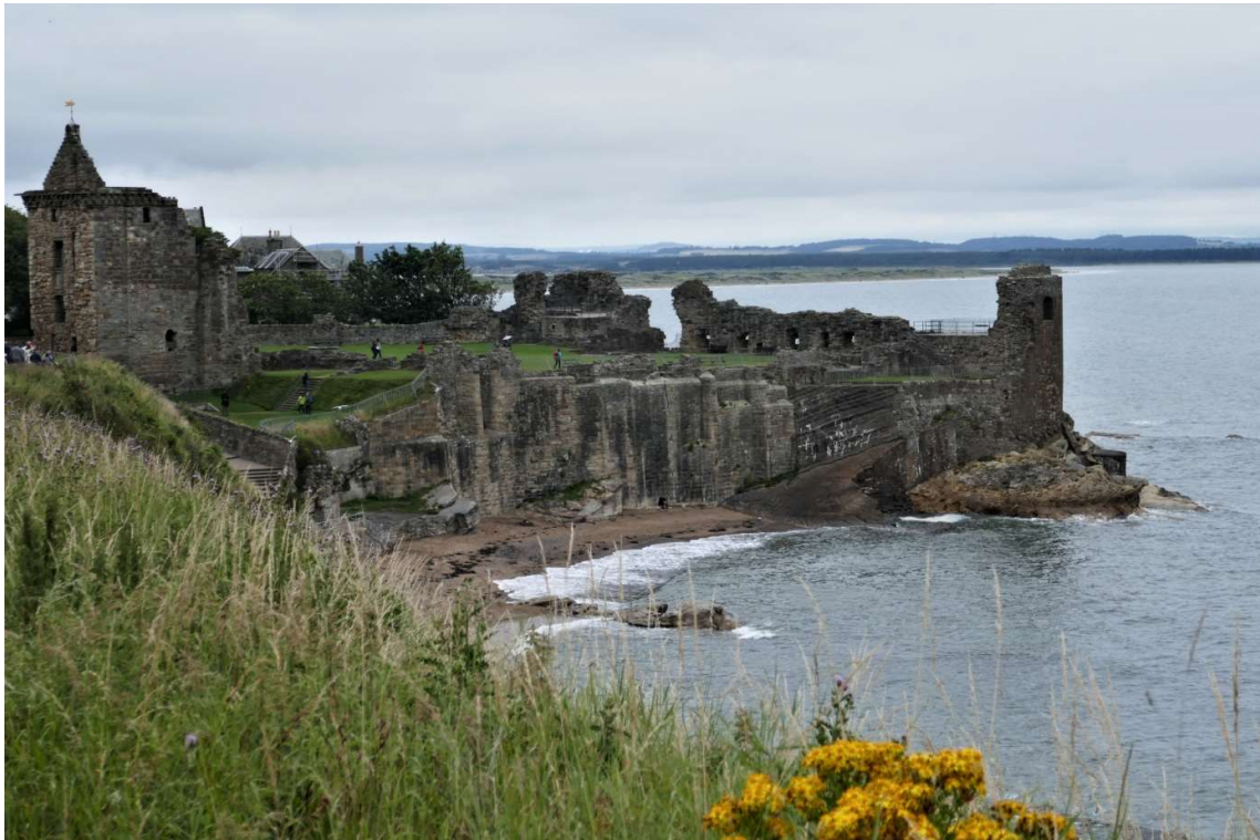
Saint Andrews, ruïne van het bisschoppelijk kasteel

werd het weer er niet beter op. Toen volgens Buienradar de zon zou moeten doorbreken, begon het te motregen. In het dorpje heb ik in een eethuisje geschild en er een lekker broodje met bacon genuttigd. Omdat ik al ongeveer de helft van de afstand naar Saint Andrews had afgelegd en de verwachting nog steeds was dat het zou opklaren, heb ik mijn weg verder vervolgd door de regen, nu langs een vrij drukke weg waarlangs zo waar een geasfalteerd fietspad liep, in Groot-Brittannië bijna een zeldzaamheid. Druk was het er bepaald niet. Ik ben zowel op de heen- als de terugweg maar één fietser tegengekomen.