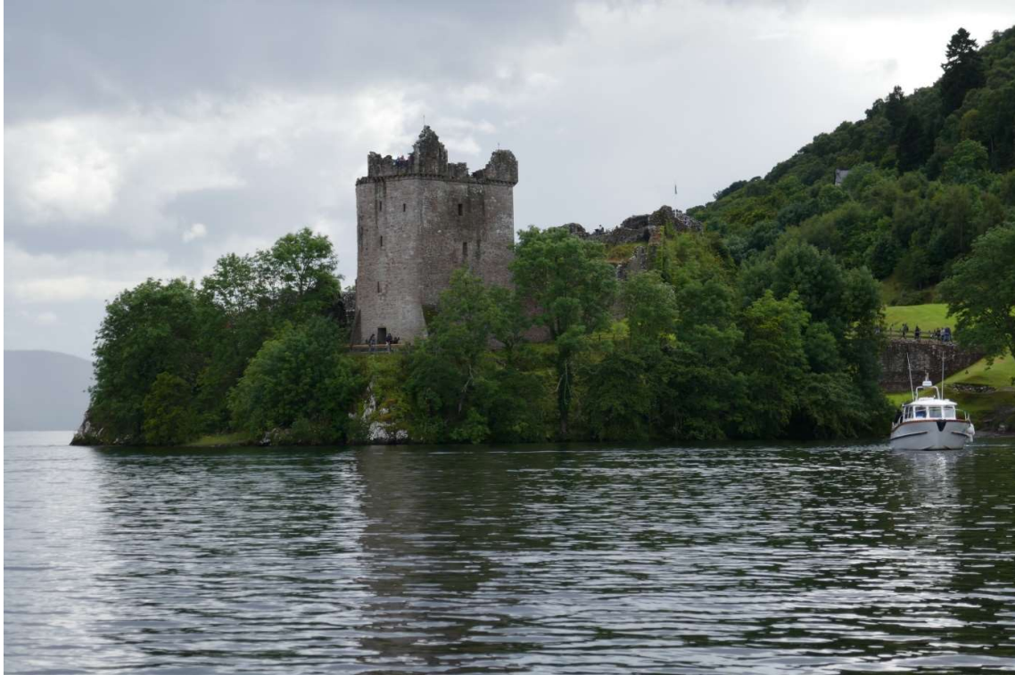
Loch Ness, Urquhart Castle

De volgende morgen zag het er stukken beter uit en ik kon weer lekker in het zonnetje mijn eitje pellen. Ik heb mijn fietsje uitgekapt en ben naar de overkant van de baai gefietst, waar het kasteel stond, een leuk tochtje. Ik bleek niet de enige liefhebber van romantische ruïnes te zijn. Loch Ness en Urquhart Castle zijn de belangrijkste toeristische attracties van Noord-Schotland. Het was zo druk in de wenteltrap van de kasteeltoren dat de dalers en de klimmers op een gegeven moment klemvast kwamen te zitten. Opvallend was het grote aantal Spanjaarden en Italianen. Wellicht waren ze naar noordelijke streken afgereisd om af te koelen van de mediterrane hitte. Dat lukte hier prima, meer dan een graadje of 18 was het niet. Ondanks de drukte was het bezoek zeer de moeite waard, ook omdat er uitstekende informatie werd gegeven over de woelige geschiedenis van het kasteel. Dat veranderde in de 18e eeuw in een ruïne toen een van de strijdende partijen tijdens de Schotse burgeroorlog het niet in handen van de vijand wilde laten vallen en daarom opblies.