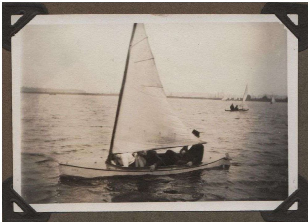
Kano met zeil (begin jaren '30)