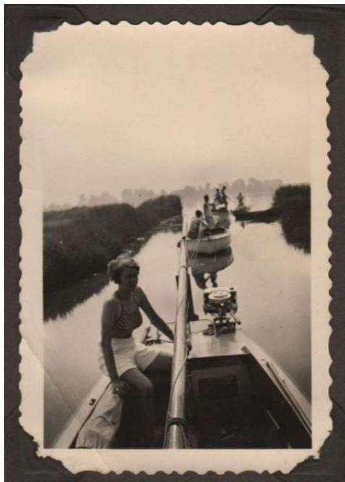
Gezamenlijke tocht (1934)