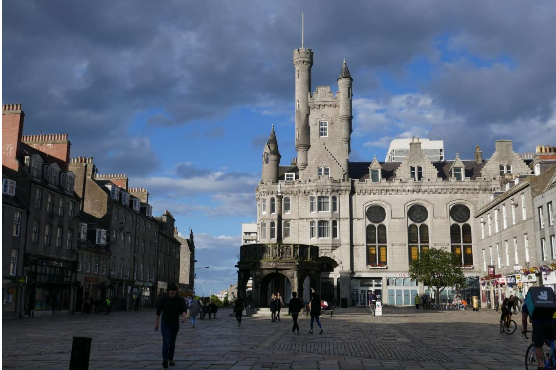
Plein in het centrum van Aberdeen