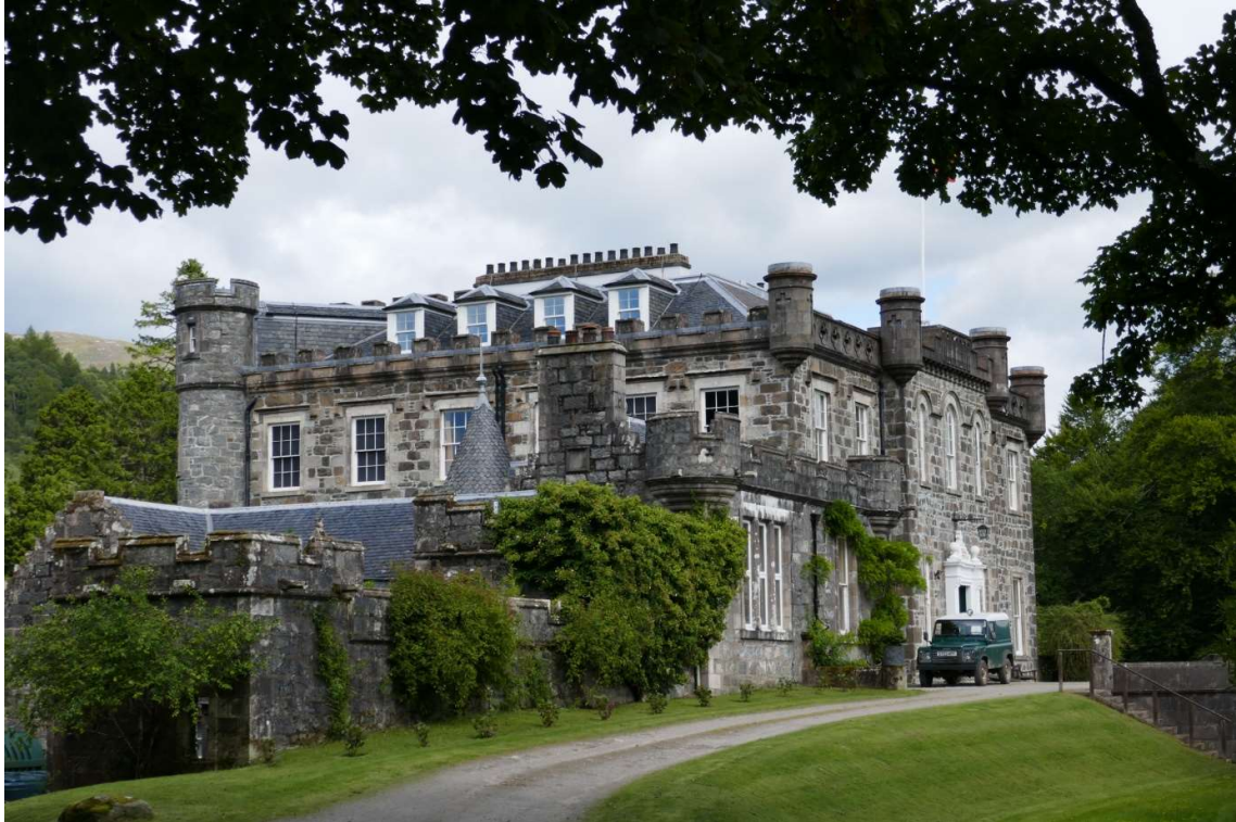
Het landhuis van de Cameron Clan

vooral de cake zeer belangrijk is. De imposante toegangsdeur stond uitnodigend open, maar toen ik naar binnen stapte kwam er direct een man in een boswachtersuniform naar me toe die vroeg wat ik wilde. Uiteraard het museum bezoeken. Dat bevond zich niet hier, maar in het gebouwtje waar ik betaald had, dit was “the castle”.