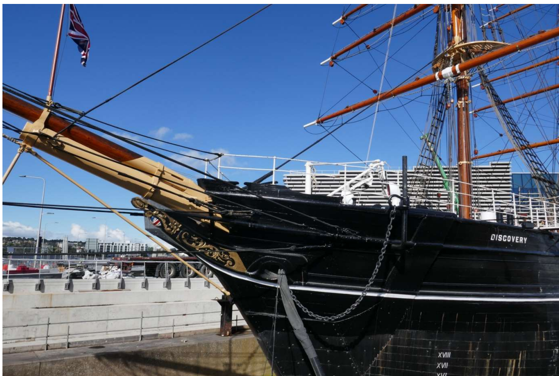
De Discovery, het schip waarmee poolreiziger Scott als eerste naar Antarctica voer, in het droogdok in Dundee

aan de jute verdiende geld veel schilderijen gekocht, waarvan er nu een aantal in het museum hingen. Er waren weer veel Nederlandse werken uit de Gouden Eeuw bij.