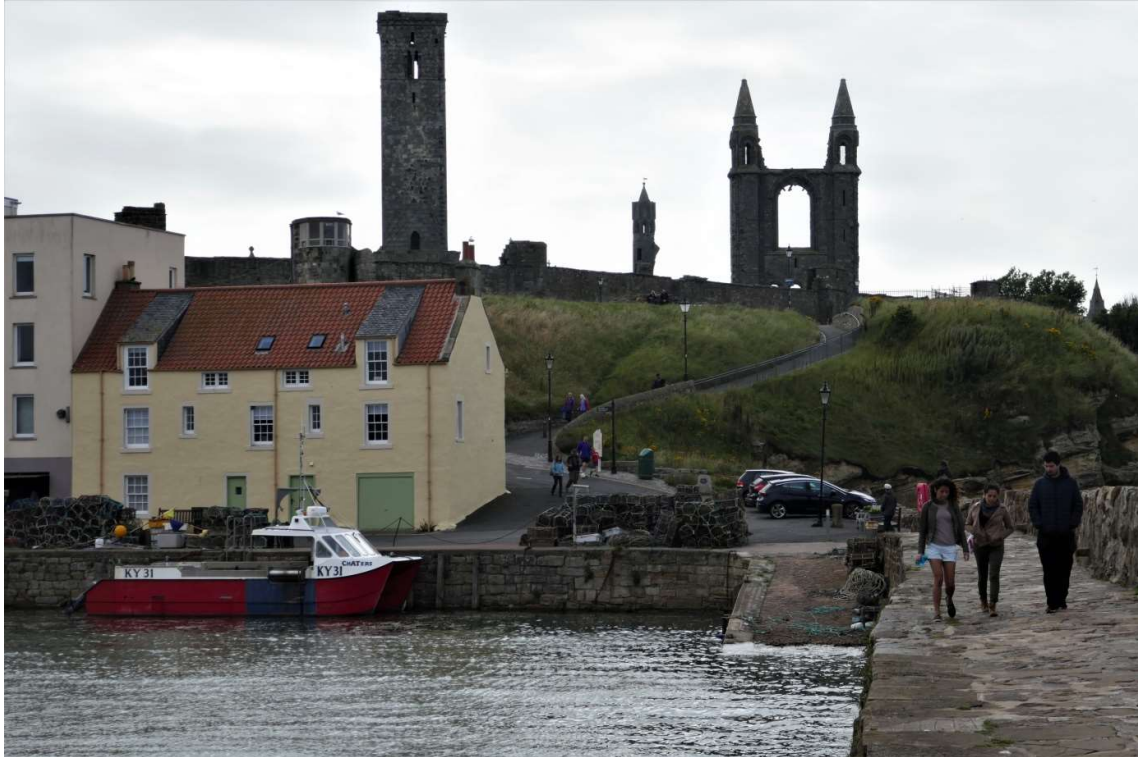
Het haventje van Saint Andrews, daarachter de ruïne van de kathedraal

ten, was de moeite waard. Na een pittig avondmaal in een Indiaas restaurant ben ik weer naar de boot gefietst, nu niet meer door het bos, maar via allerlei B-weggetjes die door het zacht glooiende heuvelland liepen. Het was gelukkig helemaal opgeklaard.