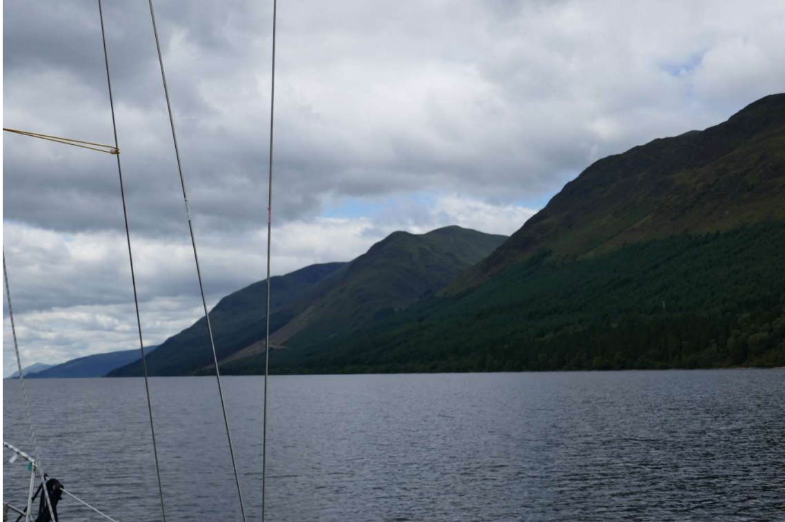
De imposante noordoever van Loch Lochy

doorweekt mijn kant uit. Deze keer hoefde ik mijn lijnen niet meer naar boven te gooien. Ik was nu het kanaal half doorgevaren en het water in de kolk stond hoog en zou gaan zakken. Omdat de sluis maar één kolk had ging het schutten vrij snel.