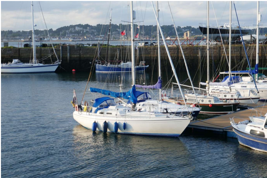
Aangemeerd in Tayport

maar er viel goed tegen in te varen. Het grootzeil had ik al gehesen en toen ik op de Noordzee mijn koers naar het noorden kon verleggen en de genua erbij kon zetten werd het een mooie zeildag. Ik heb genoten van de jan-van-genten die rondom de boot voortdurend fonteinen van water lieten opspatten als ze een vis probeerden te bemachtigen. Ze deden dat door hun vleugels in te trekken en dan als een baksteen op hun prooi te vallen. Ruim aan de wind, met nog steeds een vrij sterke ebstream in de rug, kwam al na een uurtje of drie kwam de aanloopton van de monding van de Firth of Tay in zicht. Dundee lag een mijl of vijf stroomopwaarts. Eerst moest ik met een ruime bocht om een aantal zandbanken heen, daarna kon ik westwaarts koersen, nu met een sterke vloedstroom in de rug. In de monding van de Tay kreeg ik bezoek van twee bruinvissen die zij-aan-zij met de boot mee zwommen, voortdurend onder de boot door duikend en soms voor de boeg zwemmend.