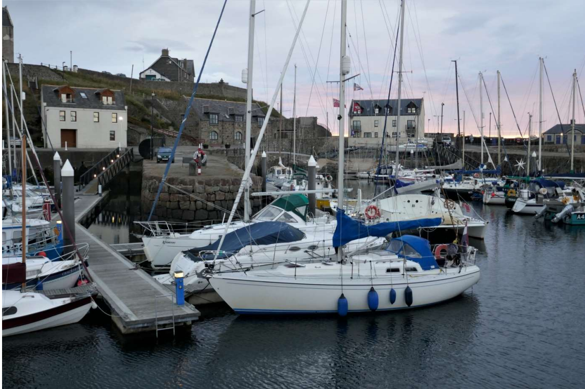
Aangemeerd in het pittoreske haventje van Banff. Schuin achter me ligt een Nederlandse catamaran

waarvan de bemanningsleden, een ouder echtpaar, even een praatje met me kwamen maken. Ze woonden nu in Groningen, maar voordat ze daar naartoe waren verhuisd hadden ze jarenlang een schip in Durgerdam gehad.