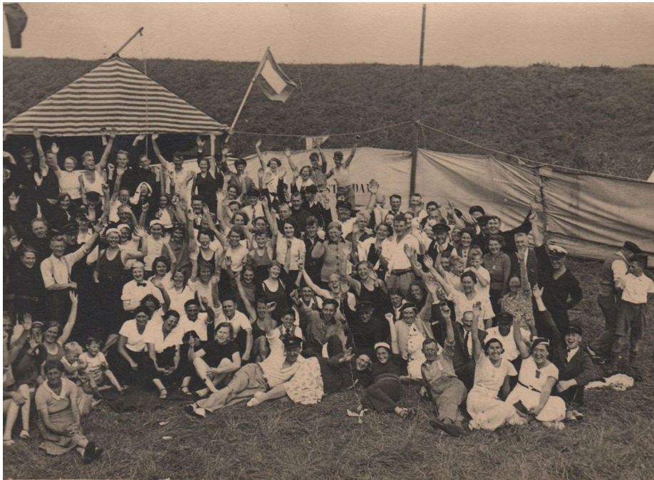
Een indrukwekkende groepsfoto uit 1938. Wie zijn dat en waar is het?

Er horen nog meer foto's bij dit artikel. Die zijn binnenkort te vinden in een fotoalbum op de site. En volgende keer dus meer over feesten, uitjes en jubilea met vooral veel foto's uit de albums van Els en Joke.