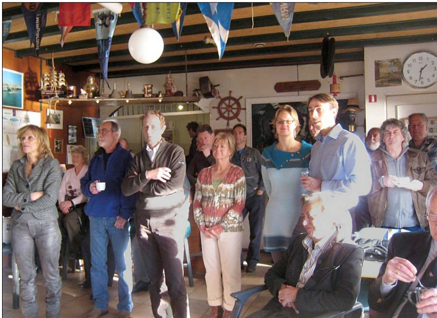
De opkomst was helaas niet groot maar de aandacht wel.