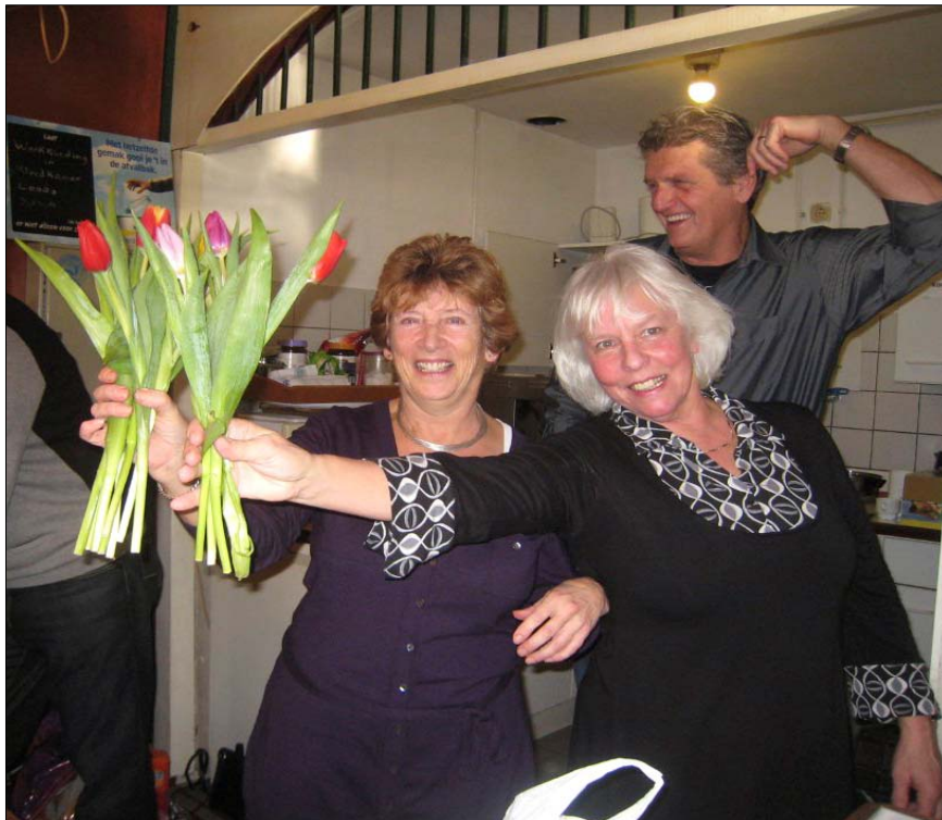
Met dank aan de evenementencommissie, die het weer goed voor elkaar had gemaakt