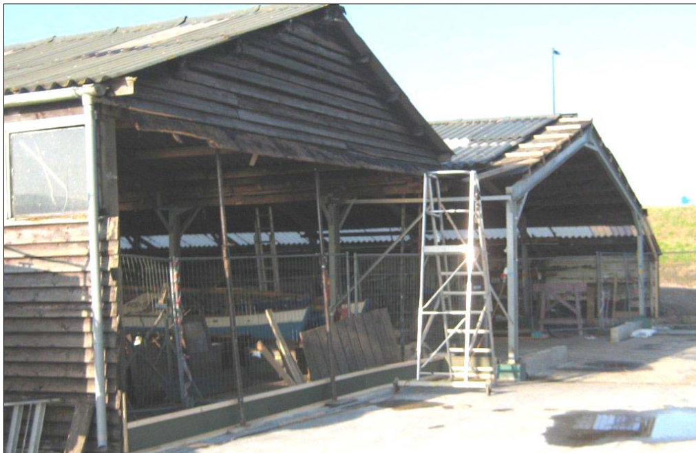
Zo zag de loods er in November 2010 uit.

Er werd een zware herfststorm verwacht. De leden van de bouwcommissie waren bezorgd. Waait het dak er af?