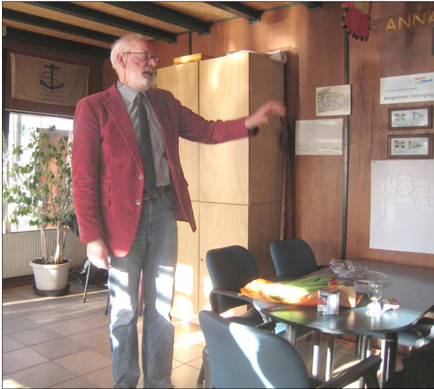
Zulke hoge golven

Een beeld van de nieuwjaarsbijeenkomst.