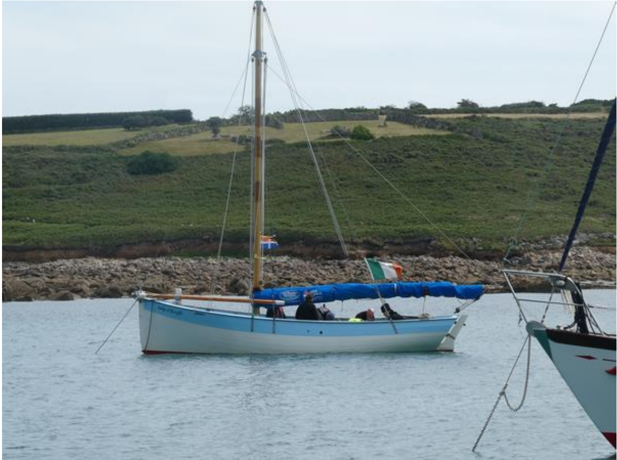
Het kottertje van de Ieren die me hielpen bij het verslepen van het bijbootje naar de waterlijn.

wieltjes, want op veel landingsplekken is het strand bij laagwater honderden meters breed. Ik kende nu de route tussen de wervelden en het terugvaren naar de boot was een makkie.