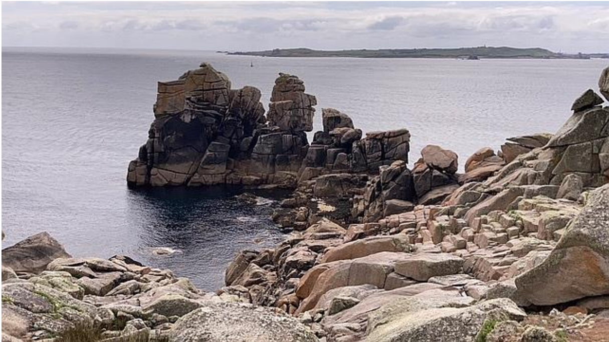
Oostkaap van de ankerbaai.

Na de kaap boog de kust naar het noordoosten en lag weer een baai, met aan de overkant een klein gehuchtje. Op de schuin oplopende oever ertegenover was het kerkhof van het eiland, met een klein kapelletje en een aantal monumentale graven, waaronder dat van Harold Wilson, in de jaren '70 voor Labour premier van Groot-Brittannië. Ik heb op een bankje van het uitzicht over de baai genoten en ben daarna via een lommerrijk paadje terug gewandeld naar Hugh Town. Toen ik in mijn bijbootje stapte landde er een bootje waarvan de bemanning mij hartelijk groette. Het waren mijn voormalige burens uit Newlyn die een dag voor mijn vertrek in de stromende regen waren vertrokken.