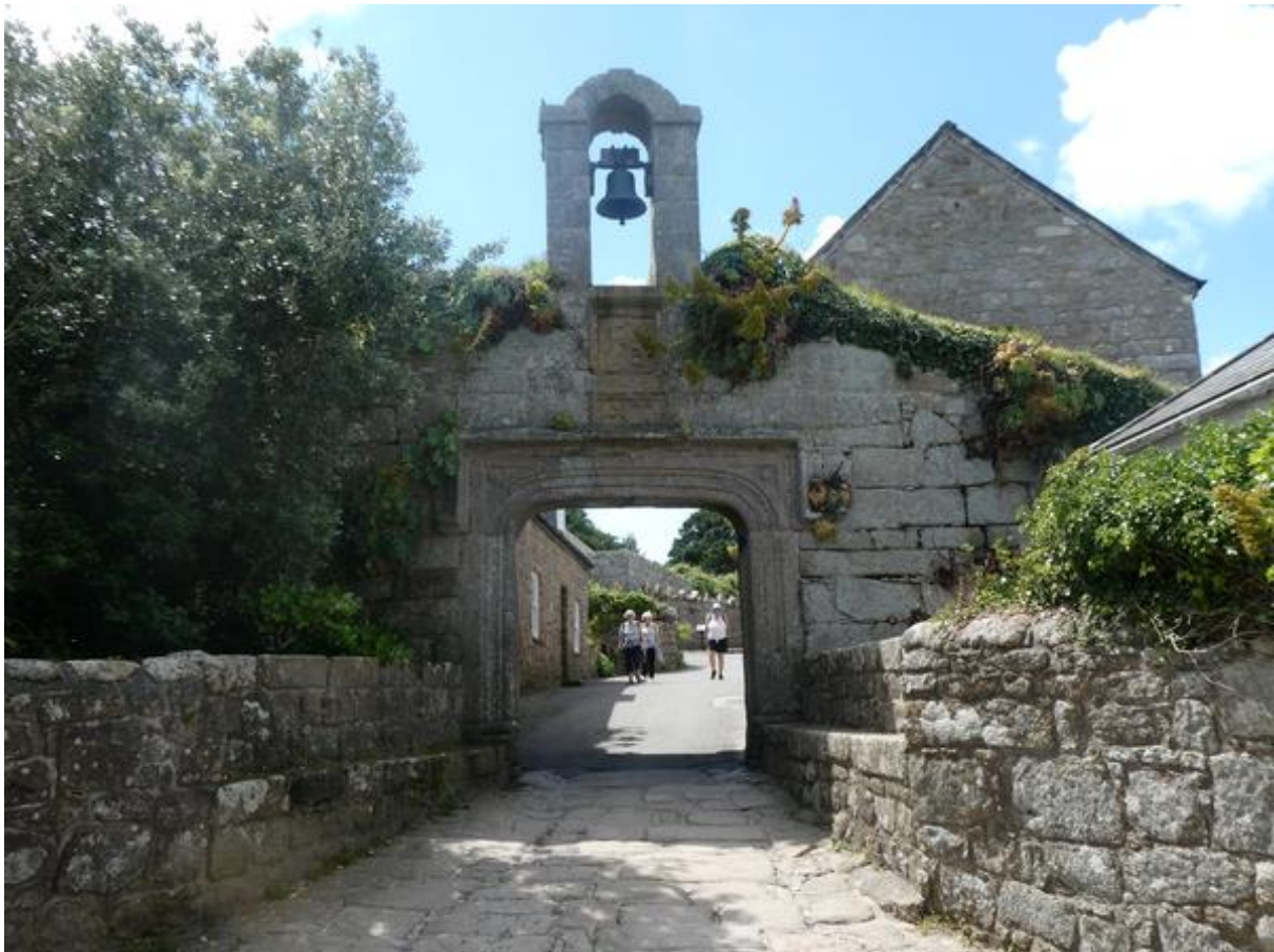
Toegangspoort van het fort bij Hugh Town.

moeten waden. Daarom droeg ik sandalen en had ik mijn sokken en wandelschoenen in een rugzakje gedaan. Nadat ik geland was, heb ik het bootje tot net boven de vloedlijn gesleept en mijn sokken en wandelschoenen aangetrokken.