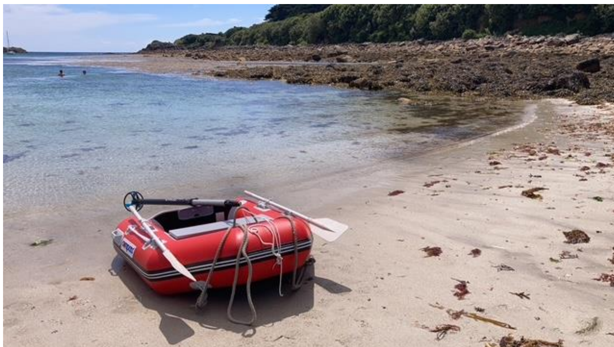
Het bijbootje heeft me veilig naar de wal gebracht.

vragen om ongelukken. Na de afwas heb ik nog een paar uur buiten gezeten. De maan kwam op en ik kon genieten van een heldere sterrenhemel. Even voor twaalven heb ik mijn kooi in de voorpiek opgezocht, maar door het rollen kwam er van slapen niet veel terecht. In de kajuit zijn de banken veel lager en daardoor merk je veel minder van het rollen. Toen ik daarnaartoe was verhuisd, was slapen geen probleem meer.