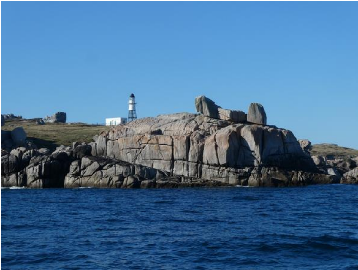
De oostkaap van de ankerbaai ten zuiden van Hugh Town.

baai in alle rust de genna inrollen en het grootzeil strijken. In de noordwesthoek van de baai zag ik een aantal jachten liggen, dus daar moest ik zijn.