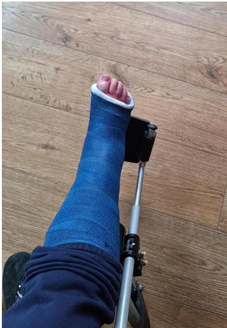
Thuis zitten wachten tot het over is.