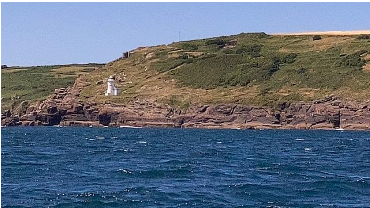
Laatste stukje Kanaalkust.

Op de weerkaarten was ook al een paar dagen te zien dat er een hogedrukgebied in aantocht was en de de dag na het vertrek van mijn burens zag het er heel wat beter uit. De bewolking en regen hadden plaatsgemaakt voor een stralend blauwe hemel en volgens de windkaarten die ik de avond ervoor had geraadpleegd zou de windkracht 2 tot 4 zijn. Ook de dagen erna was het ongeveer hetzelfde weer. Mijn plan om de Scilly Islands te bezoeken en over te steken naar Ierland, kon waarschijnlijk toch doorgaan, ik kon in ieder geval proberen om de eilanden als tussenstop te gebruiken. Toch zat ik nog een beetje te twijfelen, want de wind was 's morgens veel harder dan op de windkaarten stond aangegeven. Ik heb even de windmeter aangezet en die sprong voortdurend naar 14 knoop, eind windkracht 4 dus. Dat betekende dat de windkracht buitengaats zeker 5 zou zijn. Ook zou ik op Het Kanaal en de Keltische Zee de wind bijna pal tegen hebben. Maar een positief punt was dat hij gaandeweg flink zou afzwakken. Daarom heb ik het er maar op gewaagd, ook omdat het maar 35 mijl varen was. Via de marifoon heb ik me afgemeld bij de havenmeester. Hij bedankte me voor mijn bezoek, dat ruim anderhalve week had geduurd, en toen ik open water had bereikt heb ik het grootzeil gehesen, met twee raffen erin, en de genua half uitgerold.