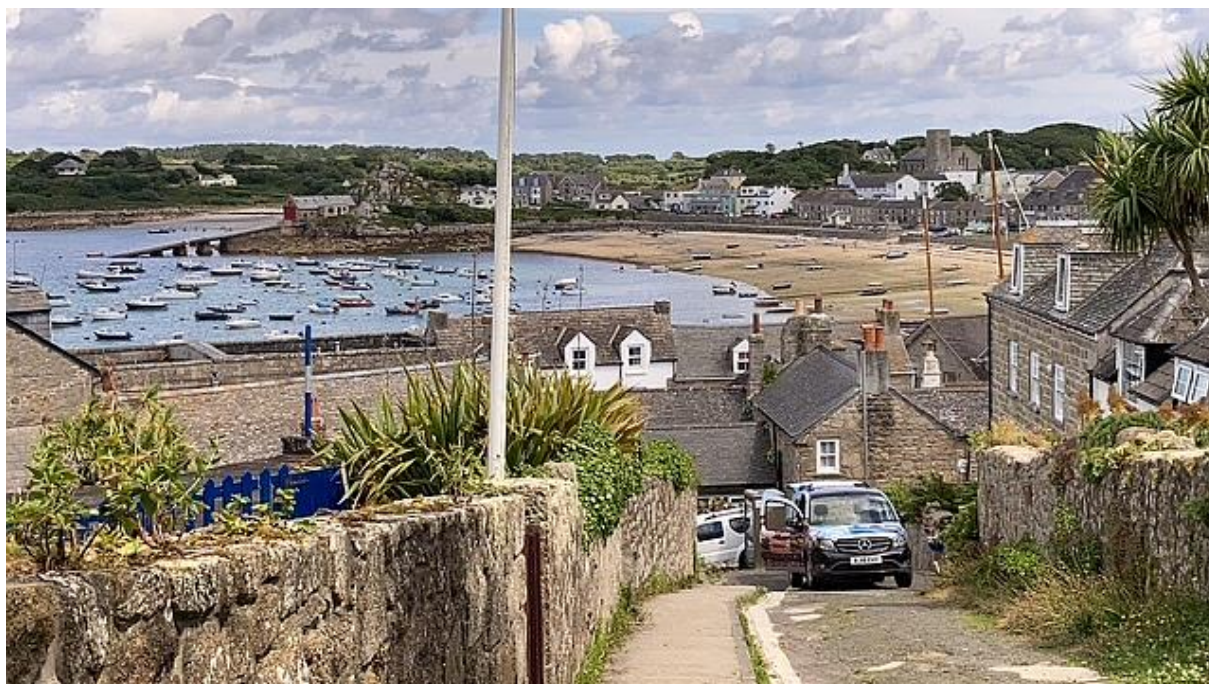
Hugh Town met de baai ten noorden van het stadje.

te bezetten. In de Tweede Wereldoorlog hadden de Duitsers de eilanden ook graag bezet, dan hadden zij immers de ingang van Het Kanaal in handen, maar mede dankzij het fort is ook dat niet gelukt. Ten zuidwesten en noorden van St-Mary's liggen de andere Scilly-eilanden en vanaf de muren van het fort had ik daar een mooi uitzicht op.