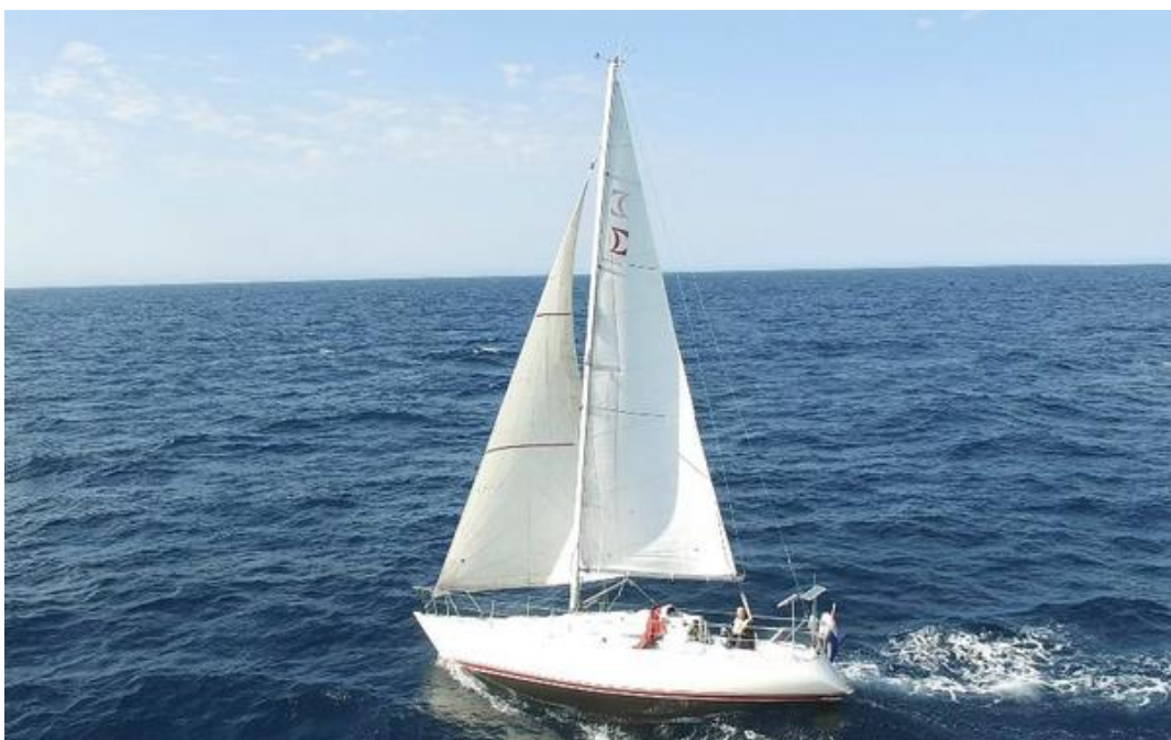
De Big Apple op de Atlantische Oceaan.

“Ik ben op 11 mei vanuit IJmuiden vertrokken met mijn Sigma 33ood “Big Apple” en, via Horta op de Azoren, op 25 juni in New York aangekomen. Zoals verwacht heb ik bijna 50% van het traject aan de wind moeten varen en bovendien moest ik vanuit Horta nog flink verder naar het zuiden uitwijken om wind boven kracht 7 te ontlopen. De terugreis vanuit New London naar IJmuiden verliep aanzienlijk soepeler en sneller (binnen 4 weken). Al met al een zeer geslaagde onderneming en een fantastische ervaring”.