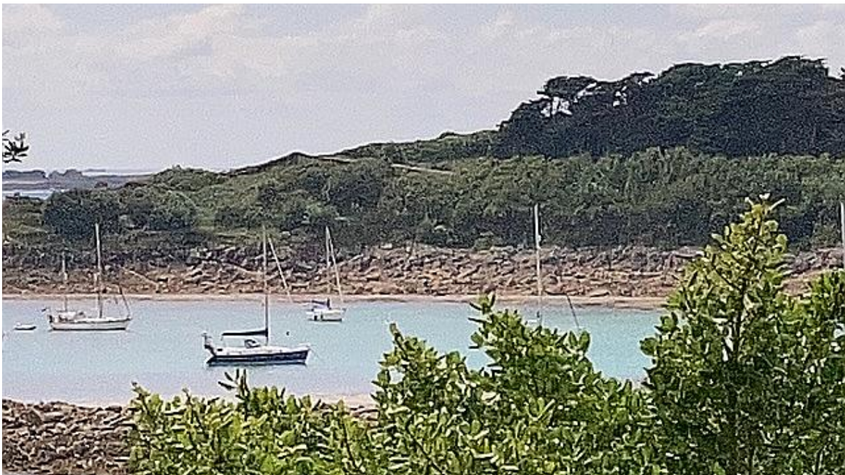
Doorkijkje over het ankerbaaitje, met links van het midden mijn schip.

De volgende dag was het nog steeds fris en bewolkt, maar het regende gelukkig niet meer en zo nu en dan liet de zon zich even zien. Toen ik zat te ontbijten voer er een Fransman langs die net zijn anker had gelicht. Hij riep wat naar me en ik verstond: “Even mijn boeitjes oppikken”. Vlak voor de westoever van de baai lagen een paar kleine witte kreeftenboeitjes en tot mijn verbazing voer hij er vlak langs en haalde ze met een haak uit het water. Er zat een kreeftenmand aan. Fransen zijn grote liefhebbers van alles wat de zee te bieden heeft en tijdens mijn reizen naar Bretagne had ik vaak gezien dat zeilers een mand aan boord hadden voor het vangen van een kreeft of krab.