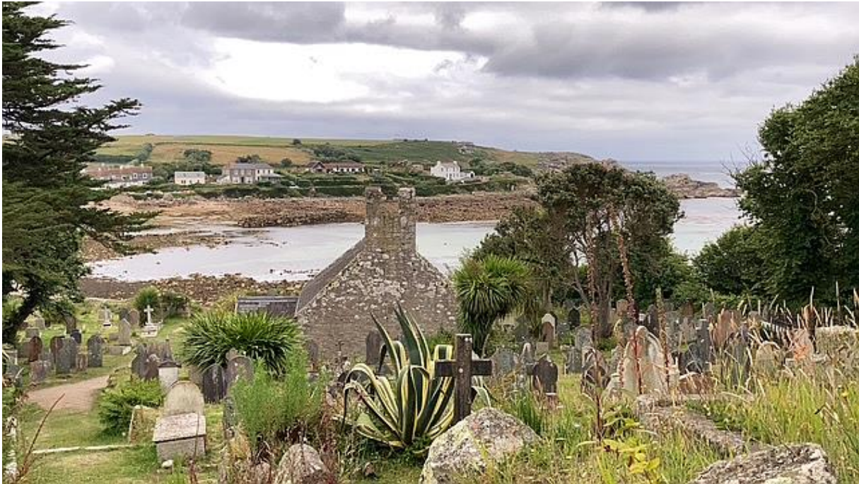
Het kerkhof van St-Mary's.

misschien niet naar de wal zou kunnen. De dagen erna zou het namelijk stevig gaan waaien.