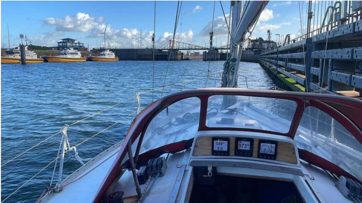
Wachten voor de sluis naar het Noordzeekanaal.