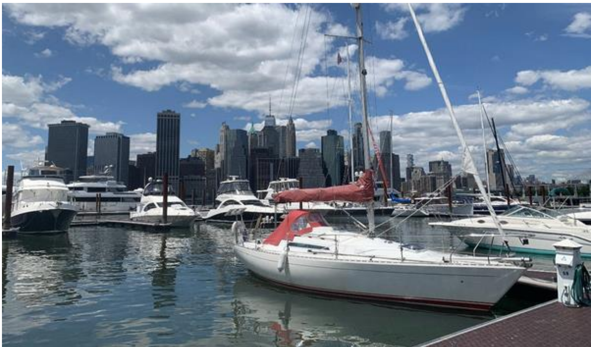
De Big Apple in New York.

Hij kocht een Sigma 33ood, voorzag het schip van de nieuwste snufjes om een veilige oversteeek te garanderen, doopte haar Big Apple en als solozeiler volbracht hij die lange tocht over de Atlantische Oceaan naar New York.