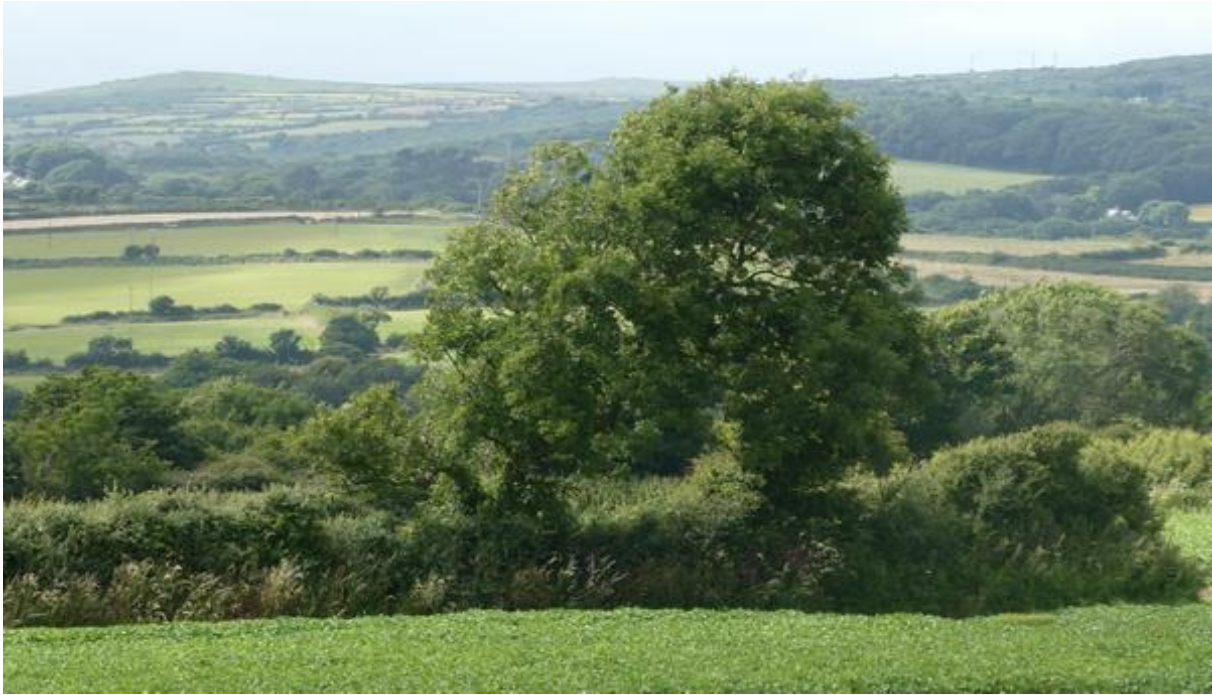
Heuvelplateau boven Newlyn.

's Middags ben ik over een steil, jungleachtig voetpaadje naar het heuvelplateau boven Newlyn geklommen. Toen ik er aankwam benijdde ik mijn vertrokken buurman en zijn vriend niet, want er stond een stijve bries die zij tot het eind van Het Kanaal pal tegen hadden.