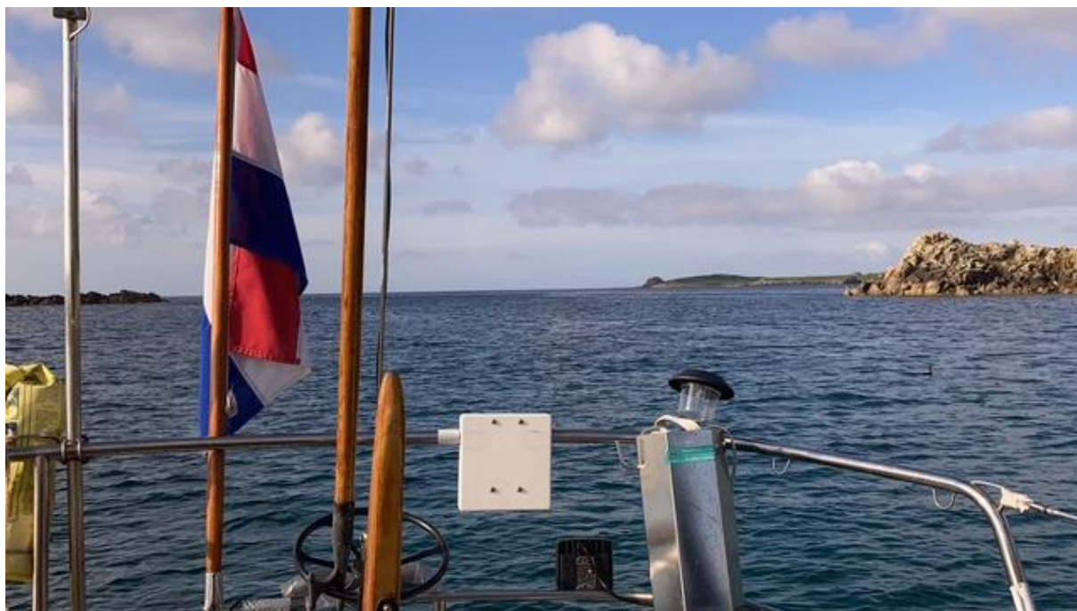
Voor anker in de baai ten zuiden van Hugh Town.

was het me nog niet gelukt om de ketting en de ankerlijn goed uitgerold op het dek te krijgen. Mijn manoeuvreerruimte was beperkt en er zat niets anders op dan de steven te wenden en weer wat ruimer water op te zoeken. Gelukkig stond er weinig wind.