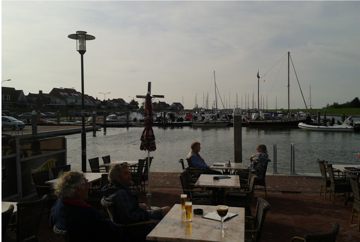
Bestemming Stavenisse in plaats van Spiekeroog.

Het weer kan natuurlijk ook niet zo erg meezitten als je onderweg bent. We lagen jaren geleden al meerdere dagen in de ons veel te drukke haven van Terschelling. Al die dagen prachtig blauwe luchten en een straffe oostenwind. Maar wij wilden (waarom eigenlijk?) naar Ameland. Er zat een front aan te komen en de wind zou spoedig naar west draaien, daar wachtten we op. Maar dat front vertraagde steeds en we bleven weer een dag langer in de haven, want ook de volgende dag zou volgens het marifoonweerbericht de wind pas in de avond draaien en het was 's ochtends hoogwater.