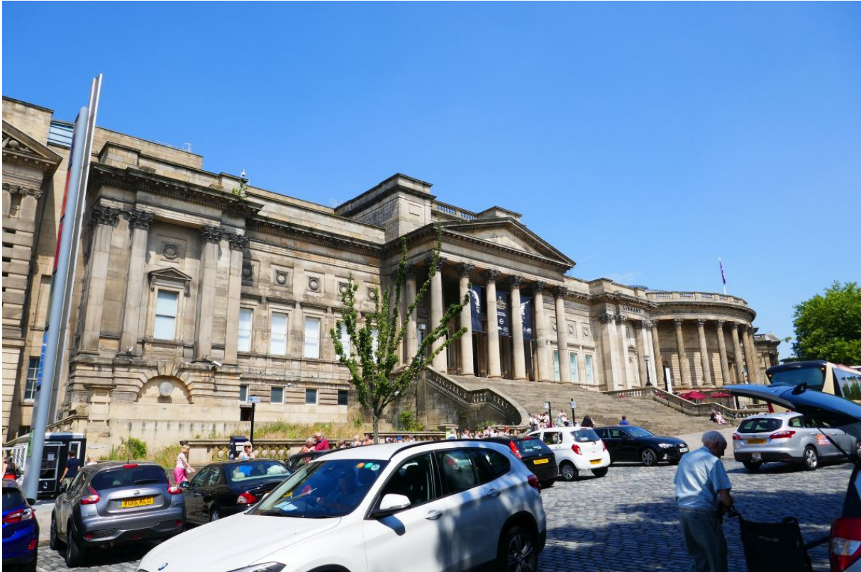
De Walker Art Gallery.

Liverpool is rijk gezegend met musea en de derde dag van mijn verblijf werd daarom weer een museumdag. Ik was vroeger een verwoed Beatlesfan, vooral Sergeant Pepper en Penny Lane hadden mijn hart gestolen, dus ik ben eerst naar het museum gegaan waar op een leuke wijze de hele geschiedenis van de groep werd gepresenteerd. Ook dit museum zat in een voormalig pakhuis. Daarna ben ik naar het oude culturele centrum van de stad gefietst, waar een aantal andere musea en de stadsbibliotheek stonden, net als de “drie gratiën” allemaal zeer imposante neoclassicistische, paleisachtige gebouwen, met grote zuilen en koepels. Ik heb hier de Walker Art Gallery bezocht, gesticht door een schatrijke en kunstminnende Liverpoolse bierbrouwer. Ik was natuurlijk weer benieuwd wat hier aan Nederlandse schilderijen zou hangen, en dat was behoorlijk wat. Helaas hing de Rembrandt nu in Edinburgh, waar een Rembrandt-tentoonstelling werd gehouden met de veelzeggende titel “The discovery of the master in Great-Britain”. Edinburgh lag dit jaar niet op mijn route, maar op de plaats van de Rembrandt hing een fantastisch portret van een nogal woeste Haarlemse doopsgezinde man, geschilderd door Frans Hals.