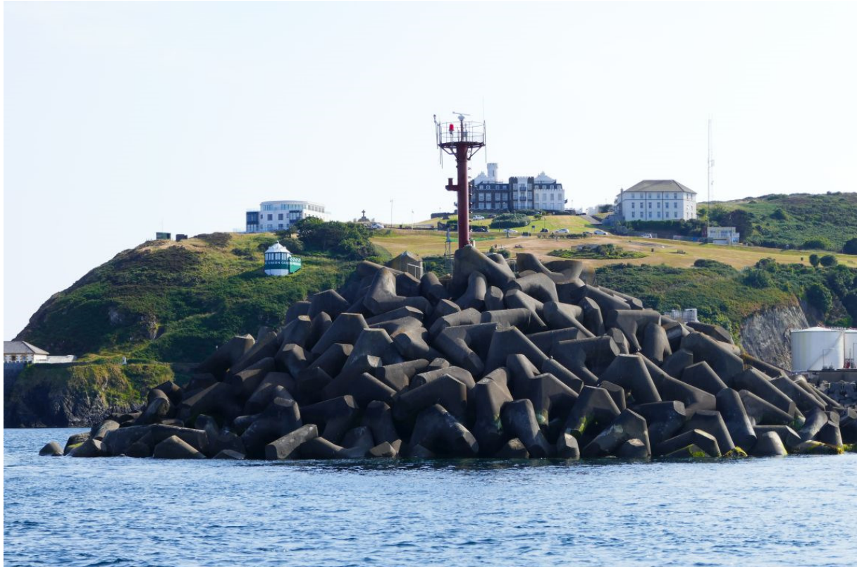
Het havenhoofd van Douglas.

Aan het eind van de morgen werd de hoge, wat grijzige kust van Man zichtbaar, maar het duurde toch nog ruim zes uur voordat ik de buitenhaven van Douglas, de hoofdstad van het eiland, indraaide. Omdat ik in de marina wilde liggen, die door een deur en een brug werden afgesloten, nam ik contact op met de havendienst. Daar werd me verteld dat ik moest vastmaken aan een wachtsteiger en moest wachten totdat ik via de marifoon zou worden opgeroepen. Toevallig lag daar een Nederlands schip uit Numansdorp, waaraan ik heb aangemeerd. De eigenaar was ook alleen op pad. Toen ik nog gezellig met hem over onze reizen en reisplannen stond te praten, meldde de havenmeester dat de brug geopend zou worden en vertelde hij me waar ik moest liggen.