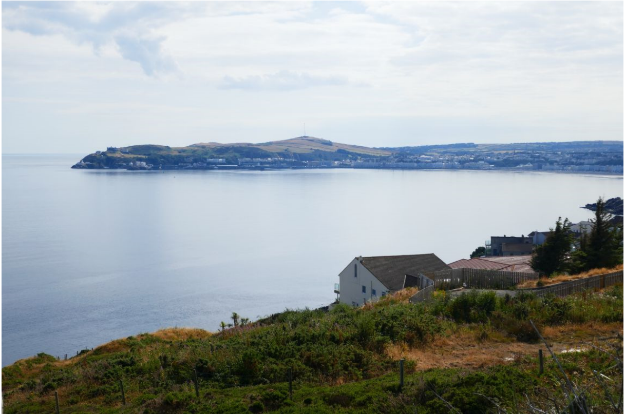
De Baai van Douglas.