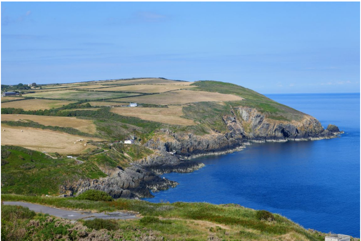
Uitzicht op de kust vanuit het treintje naar Ramsey.