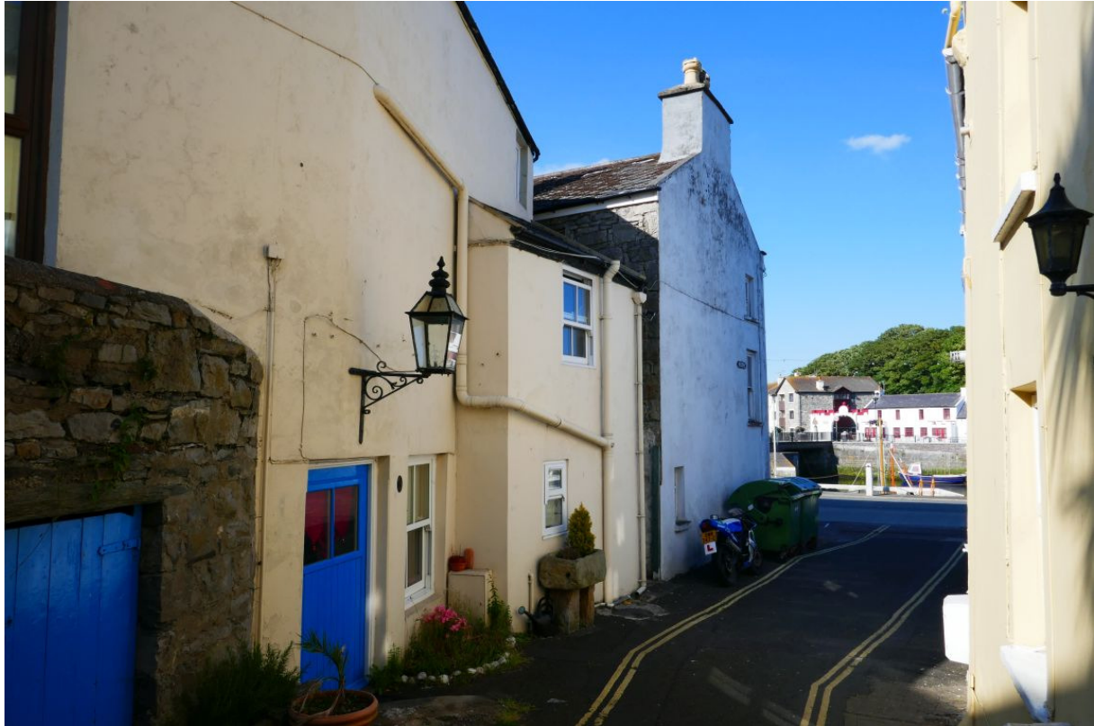
Eén van de schilderachtige straatjes in Castletown.

Door het al het gefiets en geloop had ik behoorlijk trek gekregen en ik moest ook nog ruim 15 kilometer terugfietsen. Ik heb daarom deze keer niet op mijn boot gedineerd, maar bij de plaatselijke Thai. Kennelijk begint mijn Nederlandse accent door het vele Engels behoorlijk weg te slijten want de eigenaresse dacht dat ik een Ier was. In Liverpool was een dame bij de infobalie van een museum ervan overtuigd dat ik Brits was. Omdat ik niet meer langs de kust ben gefietst maar over een vrij drukke weg zonder fietspad, was de terugreis minder leuk, maar iedere keer als een auto mij passeerde ging die ruim om me heen en werd er flink vaart geminderd. 's Avonds was ik behoorlijk moe van al het geklim en viel ik als een blok in slaap.