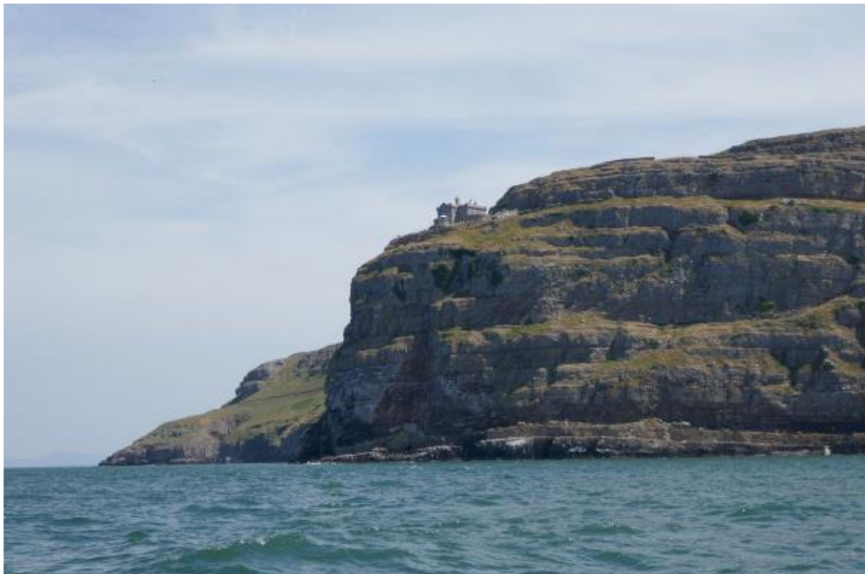
Na de ronding van de imposante kaap ten noordoosten van Conwy vaar ik weer op de Ierse Zee.

Het probleem was echter dat de sluis na tien uur niet meer werd bediend. Eerder vertrekken was geen optie omdat ik dan op de Mersey nog stroom tegen zou hebben. Die was te sterk om er tegenin te varen. Ik kon pas de volgende dag rond de middag geschut worden, wat betekende dat ik ergens in de buurt van de sluis moest zien te overnachten. Ik had mijn hoop gevestigd op een mededeling in een van mijn vaargidsen dat er vlak voor de sluis een wachtsteiger was, maar in mijn andere vaargids stond een foto van de sluis en daarop was geen steiger te zien. Wel werd er gesproken over een aantal meerboeien aan de overzijde van de rivier. De volgende morgen heb ik de Liverpool Marina gebeld om te vragen of er wel of geen wachtsteiger was. Die was er niet, maar ze hadden wel een positief bericht voor me: als ik dat wilde kon ik 's nachts om half een geschut worden en schuin tegenover de haven lagen inderdaad meerboeien waaraan ik kon vastmaken om de wachttijd te overbruggen.