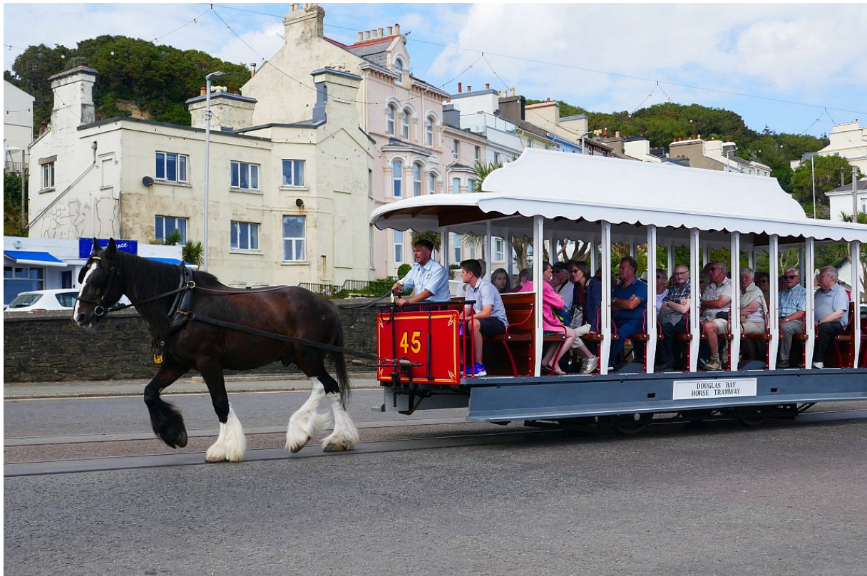
De ruim 150 jaar oude paardentram op de boulevard van Douglas.

De volgende dag heb ik het wat rustiger aan gedaan. Ik heb eerst de stad verkend en er vervolgens een uurtje omheen gefietst. Douglas is schitterend gelegen aan een grote baai en heeft, zoals alle Britse badsteden die ik bezocht had, een mooie wandelboulevard die in alles herinnert aan de Victoriaanse tijd. Hier geen lelijke hoogbouw, zoals in Zandvoort, maar rijen goed geconserveerde chique 19 e -eeuwse huizen, een rijk gedecoreerd opera- en concertgebouw en een ruim 150 jaar oude paardentram. De tocht over de heuvels achter de stad vergde weer veel klimwerk, maar was schitterend. Er werd die dag een wielertour, een 'rondje Man', gehouden, die 's morgens van start was gegaan op de kade schuin tegenover de boot. Om na mijn fietstocht bij mijn schip te komen moest ik de finish passeren. Er stonden veel mensen langs de kant en renners waren er niet te zien. Ik besloot daarom met mijn fietsje in de hand de finish over te wandelen. Toen ik die passeerde werd er op het terras ernaast luid geapplaudisseerd.