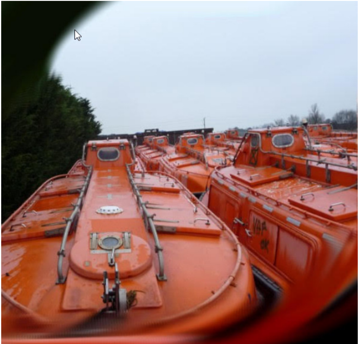
Een hele vloot broertjes en zusjes.

De Proto, 8,5 m lang (inclusief ankerplateau), 3,2 m breed en met een diepgang van 90 cm (de hak, de rest is 40 cm), is van polyester gemengd met aluminiumdioxide als brandvertrager. Hij werd met broertjes en zusjes door een handelaar als deklust van Oslo naar Delfzijl vervoerd. Daarna werden de boten stuk voor stuk op een dieplader naar Enkhuizen gebracht.