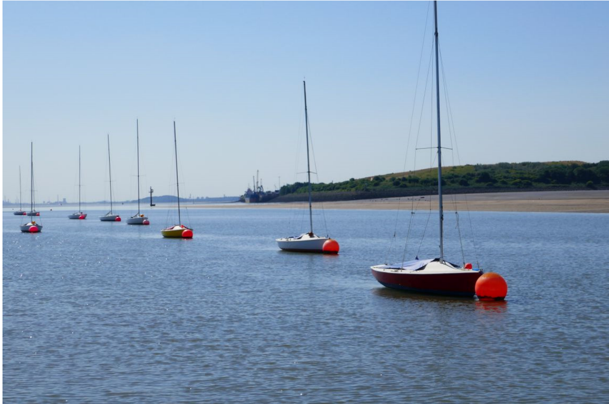
Uitzicht op de zuidoever van de Mersey.

Even voor half een heb ik de motor gestart en de lijn losgemaakt. Toen ik koers zette naar de sluis stond het licht al op groen. Samen met een politievaartuig werd ik geschut. In de sluis kwam er een medewerker van de marina aan boord om me de weg te wijzen naar een plekje waar ik kon aanmeren. Vanwege mijn rood, wit en blauw dacht hij eerst dat ik een Fransman was, maar toen hij zag dat de naam van mijn thuishaven eindigde op “dam” wist hij dat ik uit Nederland kwam. Hij had er zelf zes maanden gewoond, boven een winkel aan het Singel in Amsterdam.