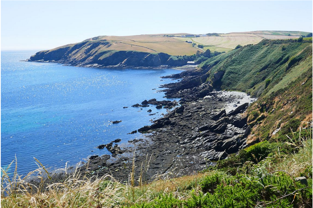
De oostkust van Man, nu van bovenaf gezien.

Het pad slingerde om talloze baaien heen en ik ben vaak even afgestapt om een fotootje te schieten van de imposante kapen die ruim honderd meter uit het water oprezen. Het zag er nog indrukwekkender uit dan vanaf zee. Daarna liep het pad door het lommerrijke binnenland. Ook schitterend, maar vanwege de steile hellingen vaak moeilijk befietsbaar.