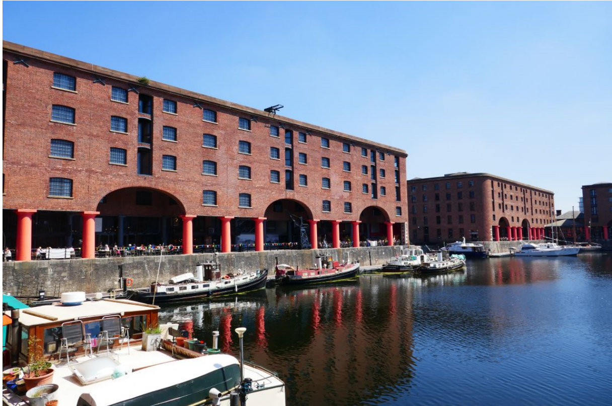
Voormalige pakhuizen langs een van de dokhavens.

Net als in Swansea en Cardiff lag de marina in een in de 19 e eeuw gegraven dokhaven die niet meer werd gebruikt. Rondom de haven stonden appartementen en twee-onder-een-kapwoningen in een eerlijk gezegd wat truttige reststijl. Een aantal huizen had kasteelachtige hoektorentjes.