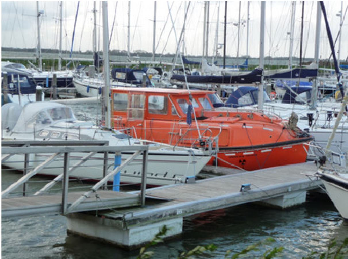
Na de eerste testvaart.

Er is drie keer een proefvaart geweest, de eerste keer in 2014, toen de aandrijving klaar was, de tweede keer nadat de stuurhut afgerond was en de derde keer toen eindelijk de binnenkant klaar was.