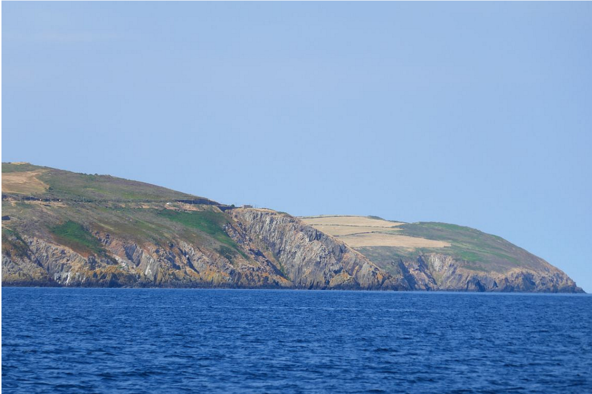
Oostkust van Man vlakbij Douglas.

Blij dat ik dit avontuur ook weer had overleefd, voer ik een half uur later de Ierse Zee op. De grote windmolenparken liet ik nu letterlijk en figuurlijk links liggen, maar op de Ierse Zee wordt ook minder schone energie gewonnen. Er zit blijkbaar veel aardolie of gas in de grond, want ik zag een aantal boorplatforms. Op een ervan werd gas afgefakkeld. Boven de hoge schoorsteen hing niet alleen een geweldige vlam, er kwam ook een enorme, diepzwarte rookpluim uit. Wat door de honderden windmolens aan CO 2 - en fijnstofuitstoot werd bespaard, werd hier volledig teniet gedaan. Wind stond er bijna niet en voor zover hij er wel stond, was hij meestal pal tegen, dus ik had vrijwel permanent de motor nodig.