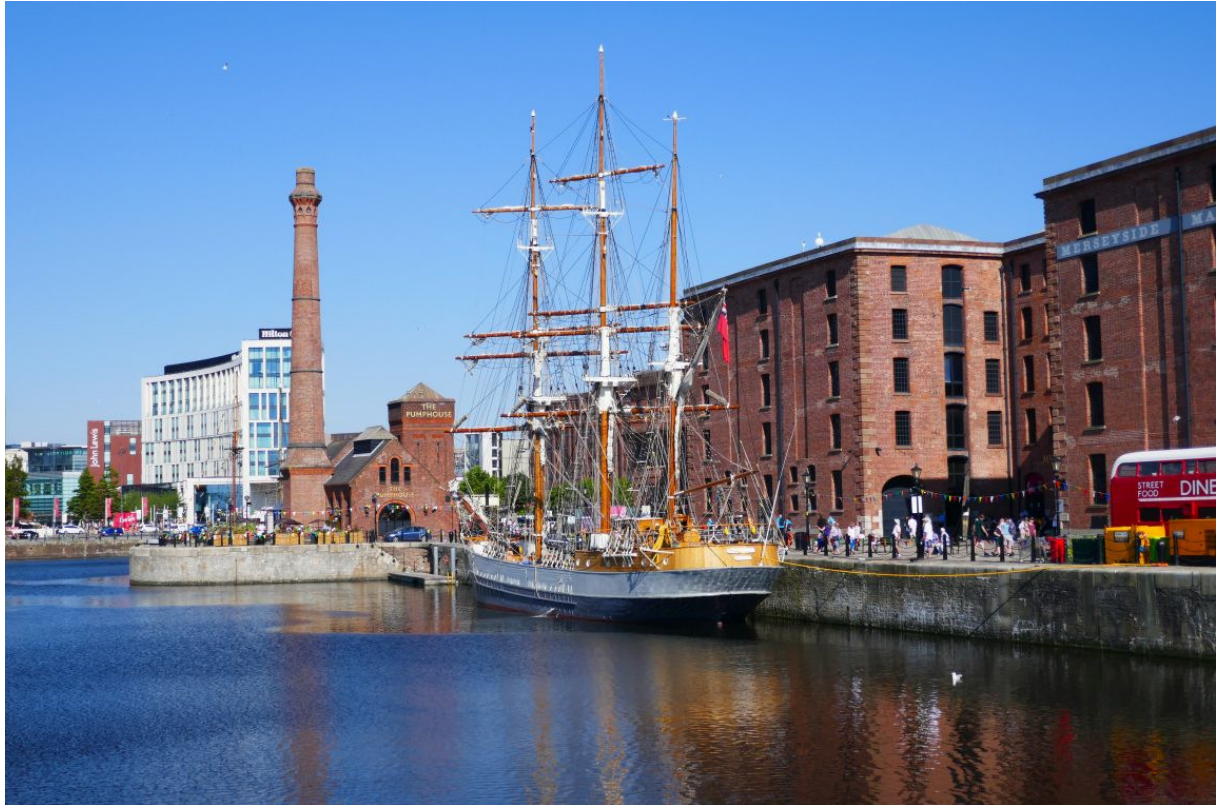
Driemaster aangemeerd voor het Mersey Maritime Museum. Links het “pumphouse”, waar de stoom werd geproduceerd voor de havenkranen.

De volgende morgen ben ik weer naar dit leuke stukje Liverpool gegaan om twee in voormalige pakhuizen gevestigde musea te bezoeken: de Tate Gallery, het museum voor moderne kunst, en het Mersey Maritime Museum, waar interessante informatie werd gegeven over de duikbootoorlog die in de oorlogsjaren op de Atlantische Oceaan heeft plaatsgevonden. Omdat de haven van Londen niet meer bruikbaar was vanwege de mijnen die de Duitsers in de Theemsmondning hadden gelegd, speelde Liverpool tijdens de oorlog een zeer belangrijke rol.