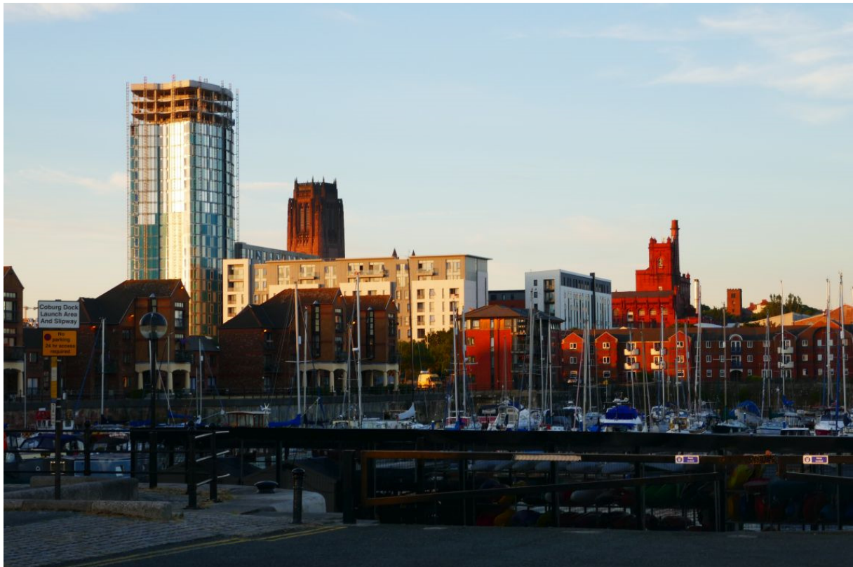
Nieuwbouw rondom de Liverpool Marina, met daarachter de toren van de Anglicaanse kathedraal.

In het havenkantoor schudde de havenmeester mij hartelijk de hand. Hij was blij dat ik ondanks de marifoonperikelen toch een plekje in de haven had gevonden. Omdat ik voor het verlaten van de haven de sluiswachter per marifoon zou moeten oproepen, wilde hij kijken of hij de kanaalinstelling van mijn mobiele marifoon kon wijzigen. Toen ik die had gebracht probeerde hij via de handleiding kanaal 37 te installeren, maar helaas ging dat niet. De fabrikant had de marifoon zo ingesteld dat daarop alleen de volgens de internationale regels gangbare marifoonkanalen gebruikt konden worden. Het Verenigd Koninkrijk hanteert echter andere regels. Verbazen deed het me niet, in het Verenigd Koninkrijk zijn veel dingen nu eenmaal anders, en getuige de Brexit wil de meerderheid van de bevolking dat graag zo houden. Maar als je een grote marina hebt en je wilt ook buitenlandse gasten ontvangen is het natuurlijk niet erg handig om een marifoonkanaal te gebruiken waarvan zij geen gebruik kunnen maken. Om me toch bij de sluiswachter te kunnen melden gaf de havenmeester me diens telefoonnummer. ■