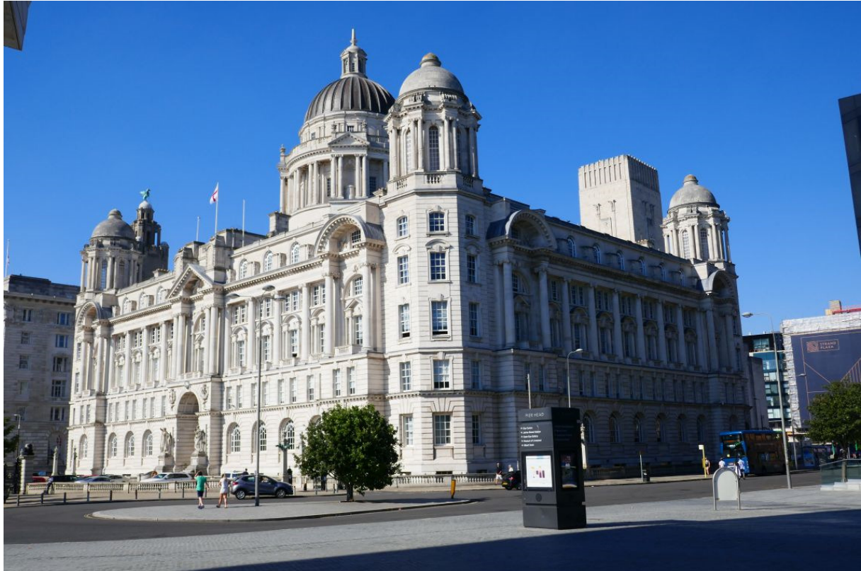
Het indrukwekkende voormalige hoofdkantoor van de Cunard Line, één van Liverpool's "drie gratiën".

's Avonds ben ik langs de Mersey naar de grote gebouwen gewandeld die ik vanaf de boot had gezien. Waar vroeger de schepen aan de kades van de rivier aanmeerden, was nu een wandelboulevard. De enorme pakhuizen waren omgebouwd tot appartementencomplexen, maar er stond ook veel nieuwbouw, o.a. een groot glazen conferentie- en expositiegebouw, een stadion en het Liverpool Museum, dat veel leek op bioscoop en filmmuseum Eye in Amsterdam. De meest indrukwekkende gebouwen waren de rond 1900 gebouwde "drie gratiën": het havengebouw Liverpool Building; Liver Building, het voormalige hoofdkantoor van een verzekeringsmaatschappij, en Cunard Building, het voormalige hoofdkantoor van de Cunard Line, lange tijd de rederij die de grootste schepen ter wereld in haar bezit had. Behalve een van de belangrijkste havensteden van de wereld, vanwaar vele emigranten naar Amerika vertrokken, was Liverpool natuurlijk ook de stad van de Beatles. Voor het Liverpool Building was het viertal in brons vereeuwigd.