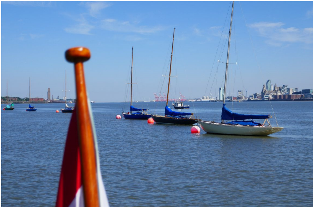
Uitzicht tijdens het ontbijt. Liverpool, helemaal rechts, ligt te blaken in de ochtendzon.

Aanvankelijk stond er een lichte deining, waardoor ik wat moeilijk in slaap kon komen, maar toen het tij kenterde werd het gelukkig veel rustiger. De volgende morgen heb ik direct de marina gebeld en uitgelegd waarom ik na middernacht geen contact met de sluiswachter had opgenomen. Even na half een kon ik geschut worden. Het was bijna eb en stond er niet veel stroom, en het boeitje en de haak werden niet meer het water in getrokken. Om te voorkomen dat ik straks de haak niet meer uit de ring van het boeitje zou kunnen krijgen, heb ik het boeitje naar boven getrokken, een lijn door de ring gehaald en de haak losgehaald.