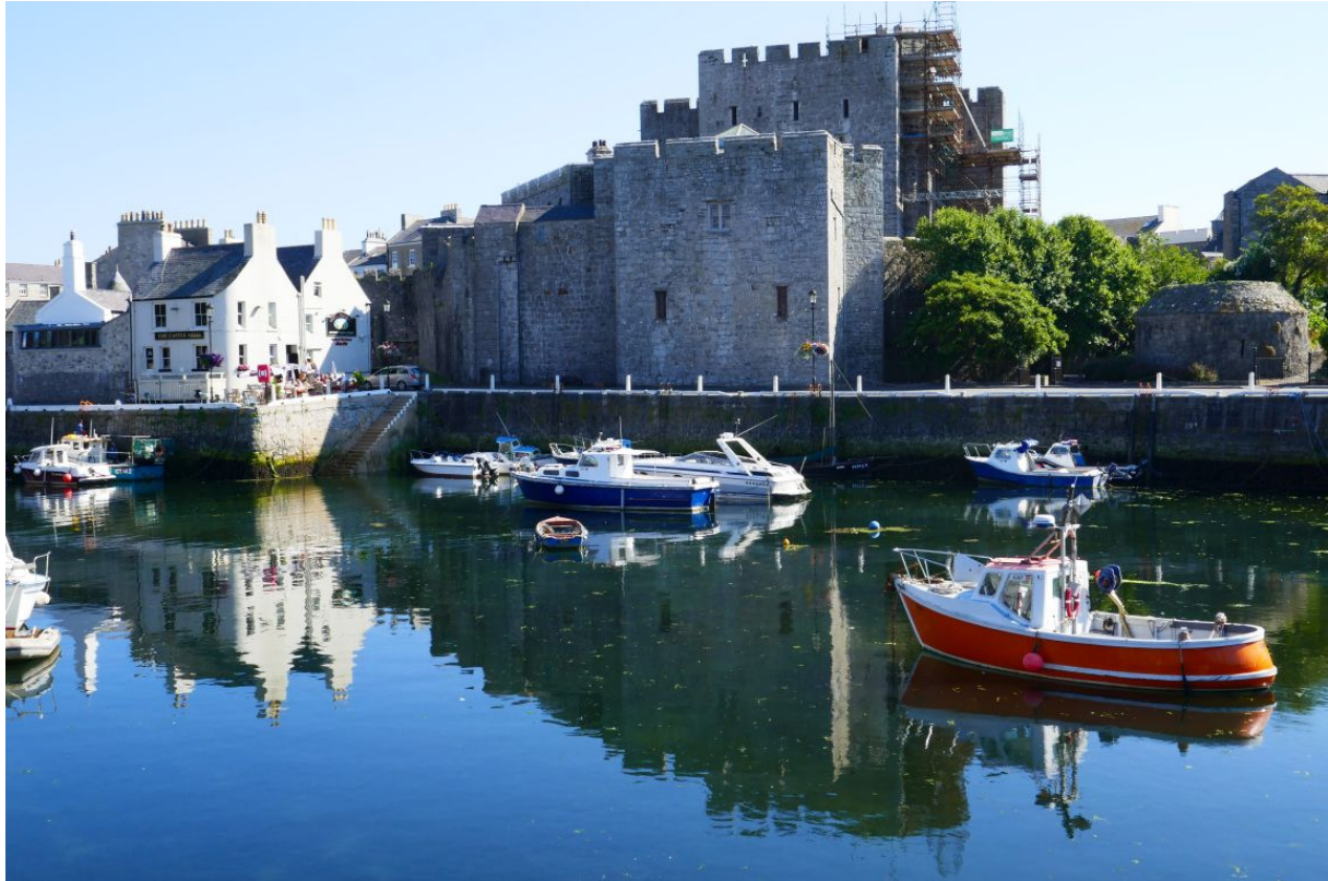
Het idyllische haventje van Castletown.

Castletown lag op een laag, vrij vlak stuk van het eiland en de laatste tien kilometer waren dan ook een makkie. Daar lag ook het vliegveld en toen ik erlangs fietste waande ik me niet op een eiland in de Ierse Zee, maar in Italië of Zuid-Frankrijk. Niet alleen vanwege de blauwe hemel en de temperatuur, maar vooral vanwege het geboomte. Hier stonden geen populieren, eiken of lindes langs de weg, maar rijen palmbomen. Ik zag ze ook in veel tuinen staan. Hoewel het eiland noordelijker ligt dan ons land, is het er vanwege de Warme Golfstroom klaarblijkelijk gemiddeld warmer.