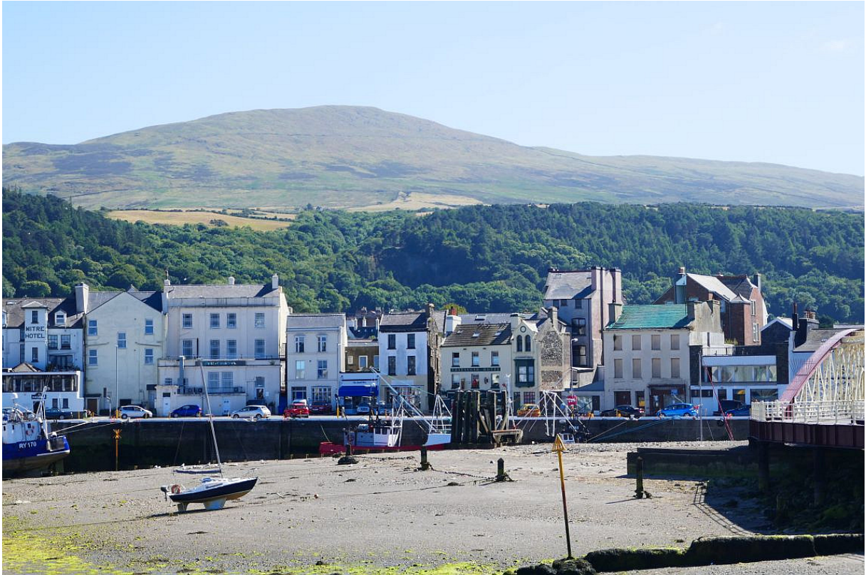
De helemaal drooggevallen haven van Ramsey.

prima. Na een kwartiertje was het tijd om weer terug tijd te lopen naar het stationnetje en hebben we hartelijk afscheid genomen.