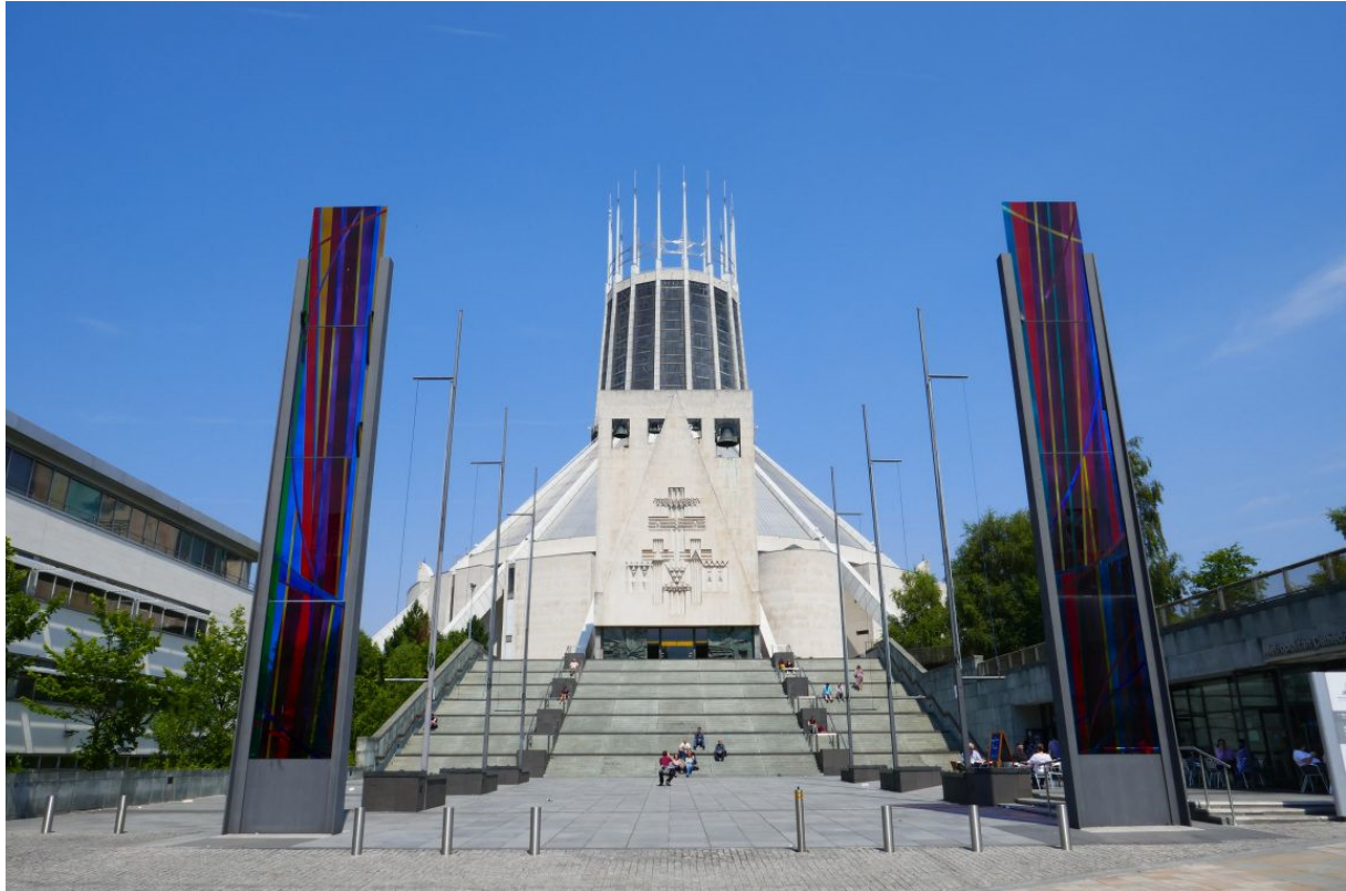
De Rooms-Katholieke kathedraal.

De tweede kerk die me bij de nadering van de stad was opgevallen was een kerk met een enorme koepel. Dat was de Room-Katholieke kathedraal, in tegenstelling tot de neogotische Anglicaanse kathedraal een hypermodern gebouw, met een merkwaardige voorgeschiedenis. Liverpool was aanvankelijk een volledig protestantse stad, maar vanwege de bloei in de 19 e en begin-20 e eeuw en de enorme armoede in Ierland, vestigden er zich veel katholieke Ieren. Toen de Anglicanen in de jaren dertig al een aardig eindje gevorderd waren met de bouw van hun kathedraal, wilden de katholieken laten zien dat ze ook meetelden. Ze besloten de op een na grootste kathedraal ter wereld te bouwen, net iets kleiner dan de Sint-Pieter in Rome. Maar toen de crypte klaar was, brak de Tweede Wereldoorlog uit en omdat daarna ook in Liverpool het rijke Roomse leven op zijn retour was, werd de bouw van de megalomane kathedraal niet voortgezet, maar kwam er een veel kleinere koepelkerk, een mooi en smaakvol gebouw moet ik zeggen. Na dit kerkbezoek had ik nog tijd om het Liverpool Museum te bezoeken, waar op leuke wijze informatie werd gegeven over de geschiedenis van de stad en de havens. Ook de Beatles kwamen aan bod, althans één voormalige Beatle, John Lennon, en zijn vrouw Yoko Ono.