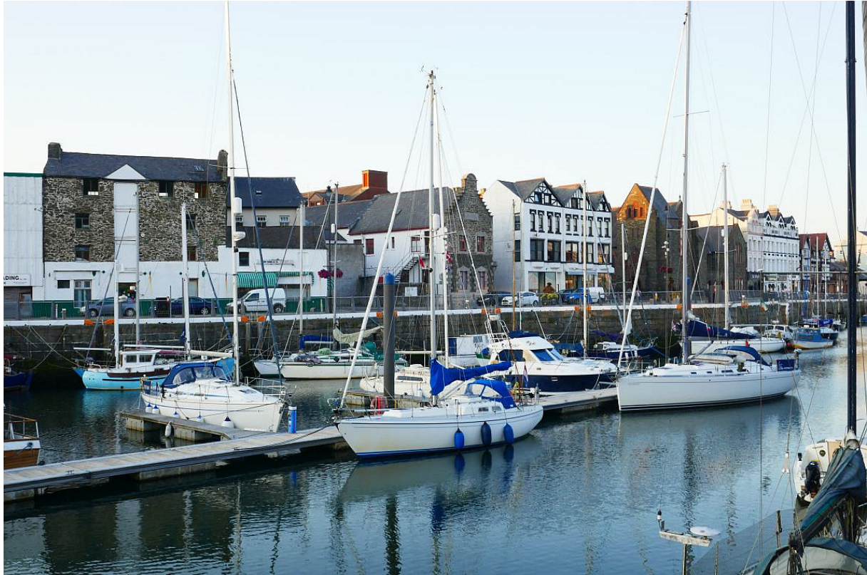
Veilig aangemeerd in het hartje van Douglas.

De jachthaven lag midden in de stad en de plek waar ik aanmeerde was schitterend. Op de kade stond een rij oude huizen en ik lag precies voor het mooiste huis, een oud koopmanshuis dat 's avonds werd verlicht. Een klein stukje verder stond een in ruwe natuursteen opgetrokken trapgevel en aan de andere kant had ik uitzicht op beboste heuvels.