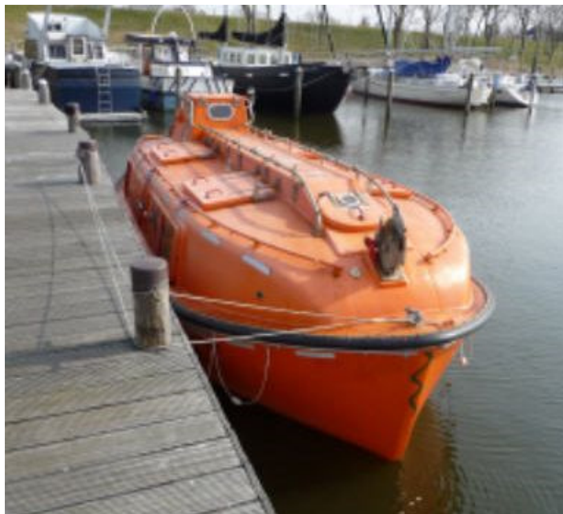
De Proto in originele staat.

was de Proto, zo heet hij, een reddingsboot bij een boorplatform, de 'Statfjord B rig 209'. Hij komt uit een nest van 34 van dergelijke boten. Deze zijn inmiddels allemaal vervangen door zogenaamde valboten. Die gaan met een vrije val het water in. Op die manier wordt tijd gewonnen omdat er geen kabels gevierd hoeven te worden.