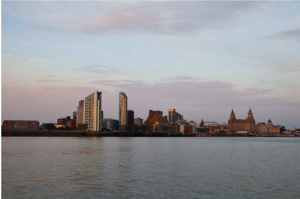
Liverpool komt steeds dichterbij.

Even later zag ik de lichten van de sluis waar ik na middernacht moest zijn en nog wat verder zag ik een rij zeilbootjes aan meerboeien liggen. Ik voer ernaartoe en vond al snel een boei die niet gebruikt werd. In Padstow was het me met uiterste krachtsinspanning gelukt om aan zo'n boei vast te maken. Je moet hem eerst zover naar boven halen dat je de lus kunt pakken die eronder hangt en dan daar je lijn doorheen halen. Als je alleen bent is dat een zwaar en vervelend klusje. Omdat de boei veel groter was dan die in Padstow lukte het me niet om hem uit het water te krijgen, maar gelukkig zag ik een eindje verderop een boeitje liggen met een ring erop. Ik heb een heklijn met een haak die ik had aangeschaft om in Zweden en Finland vast te kunnen maken aan hekboeien, en die kon ik nu goed gebruiken. Er stond flink wat stroom en het boeitje schoot iedere keer weg als ik er langs voer of er tegenaan probeerde te drijven, maar na een aantal pogingen lukte het om aan te haken. Daarna kon ik volop genieten van het uitzicht op de stad, waar de lichten aangingen.