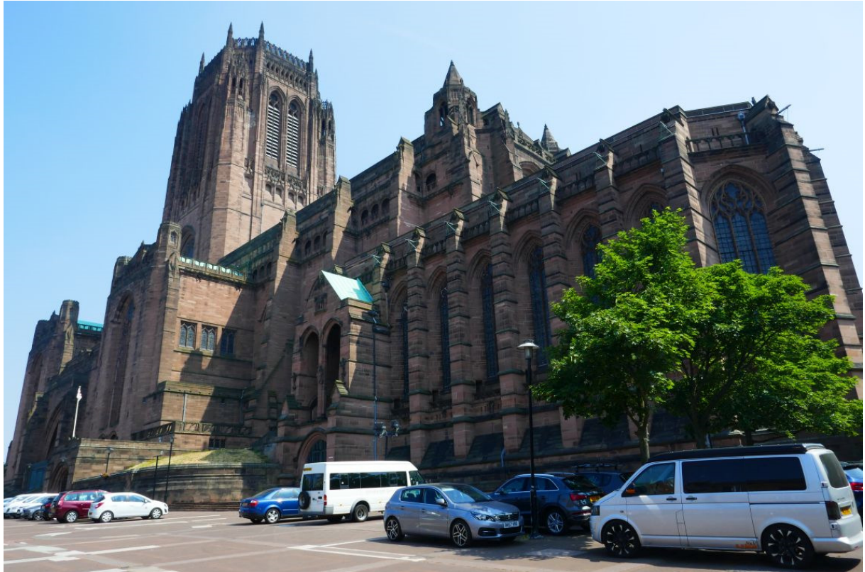
De Anglicaanse kathedraal.

Op de vierde dag van mijn verblijf wilde ik nog wat gebouwen bekijken die de skyline van Liverpool domineerden. Allereerst de Anglicaanse kathedraal, de enorme kerk op de heuvel. Hij stond niet ver van de haven en vanaf de boot had ik er een mooi uitzicht op. Van dichtbij en vooral van binnen was hij nog indrukwekkender. Oud was hij niet, aan het begin van de 20 e eeuw was men met de bouw begonnen en pas in de jaren 80 was hij voltooid.