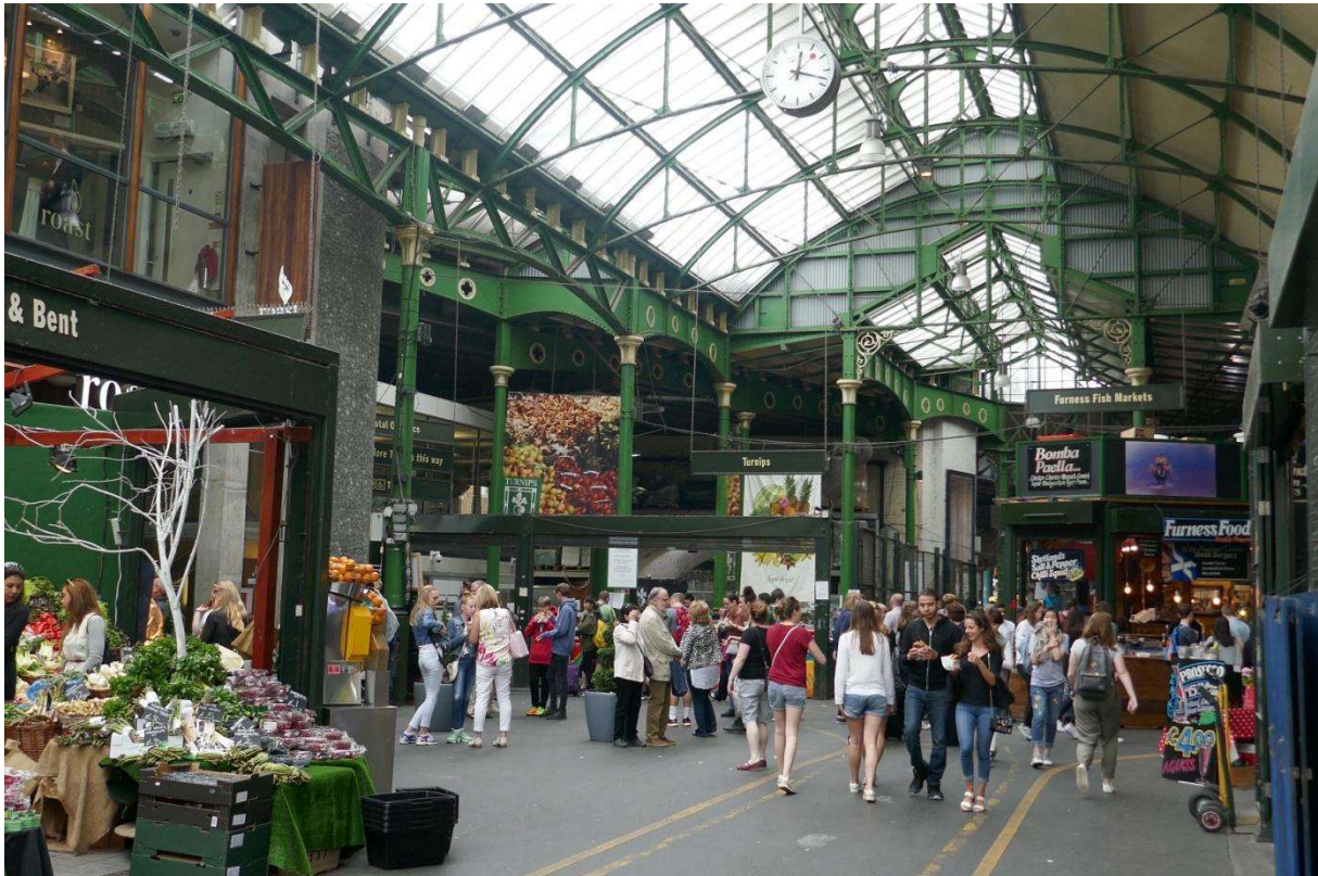
De gezellige Borough Market, waar een paar dagen later een aanslag zou plaatsvinden

lazen we dat er op de London Bridge en de Borough Market net een aanslag had plaatsgevonden met een busje dat talloze mensen omver had gereden. Zouden we zijn uitgestapt bij station Cannon Street dan hadden we de oprit van de London Bridge moeten oversteken op de plaats waar het busje met zijn dodelijke tocht was begonnen. De London Bridge is nog een aantal dagen afgesloten geweest en de Borough Market, waar ik een paar dagen ervoor nog een lekker Indiaas hapje had gegeten, is tijdens ons verblijf gesloten gebleven.