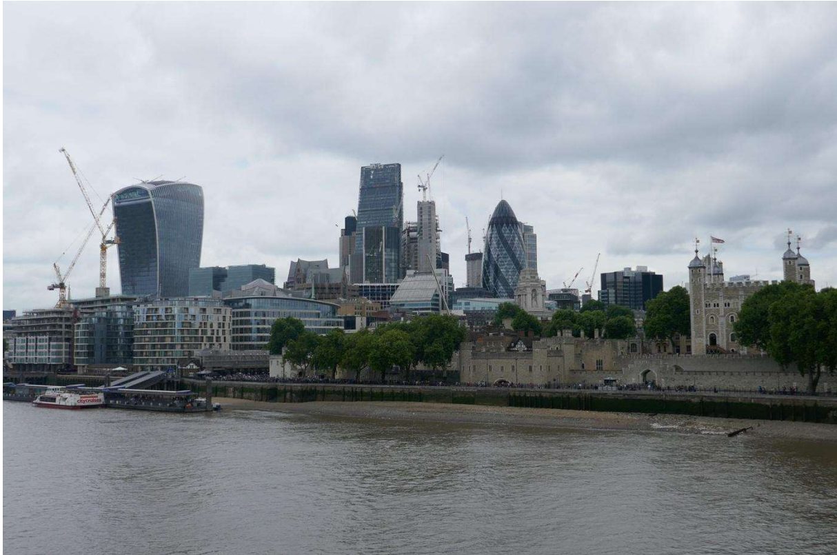
De skyline van modern en middeleeuws Londen: links en in het midden de City, rechts de London Tower

Na mijn zesdaagse tocht van Durgerdam naar Londen, heb ik nog zestien leuke dagen in de Britse hoofdstad doorgebracht. St. Katerine's Dock was vroeger de belangrijkste aanvoerhaven van thee. In de pakhuizen waar die werd opgeslagen zitten nu appartementen en een hotel en er staat wat nieuwbouw om de haven, gedeeltelijk gebouwd in dezelfde stijl. De haven was bepaald niet goedkoop. Omdat ik er meer dan twee weken heb gelegen kreeg ik korting, maar ik was per dag toch nog ruim 55 euro aan liggeld kwijt. Maar voor dat geld heb je ook wat. Ik lag midden in een wereldstad, met alle bezienswaardigheden op loopafstand. De dag na mijn aankomst ben ik over de Tower Bridge naar Southwark gewandeld en heb ik de zuidoever van de Thames verkend en het Tate Modern, het museum voor moderne kunst, bezocht. De twee volgende dagen heb ik achtereenvolgens de City verkend en Westminster, met de Big Ben en het parlamentsgebouw. In de City werd het straatbeeld gedomineerd door Zuidas-types, de dames meestal strak gerokt en de heren vrijwel allemaal in een wit overhemd met een antracietkleurige broek en een dito jasje, snel voortstappend op de drukke trottoirs, intussen druk in de weer met hun smartphone. Voetgangersstoplichten werden massaal genegeerd en zo nu en dan flitste er een sportief uitgedoste fietser op een racefiets, mountainbike of vouwfiets voorbij. In de National Gallery, aan de gezellige Trafalgar