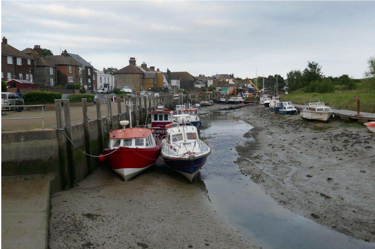
De Swale, het water tussen Sheppey en het vasteland van Kent, bij eb

's Nachts leek er een einde te zijn gekomen aan het warme zomerweer. 's Middags had er boven de Thames al een loden onweerslucht gehangen, maar daar vielen maar een paar druppels uit. Even na middernacht kletterde de regen echter op het dek en bliksemde en donderde het flink, wat mijn nachtrust uiteraard niet ten goede kwam. Toen ik om zeven uur opstond was het een stuk rustiger geworden. Er was wel regen voorspeld en het was zwaar bewolkt, maar er scheen zo nu en dan ook een flauw zonnetje. De wind was oost, voor mij uiteraard zeer gunstig, maar hij was vrij zwak. Omdat het rond tien laagwater was en de havenmeester en de burens me hadden geadviseerd om twee tot een uur voor laagwater te vertrekken, gooide ik om half negen de lijnen los. Dan had ik tot in Londen de stroom in de rug. Tot aan de Thames had ik stroom tegen, maar toen ik westwaarts kon koersen kreeg ik een flinke stroom in de rug. Mijn bestemming was de haven St. Katharine's Dock, in het hartje van Londen, vlak naast de Tower Bridge en de London Tower, waar ik een paar dagen tevoren een plekje had gereserveerd. Kennelijk was ik niet de enige Nederlander die naar Londen wilde, vanaf de Medway kwam een groepje van zeven Nederlandse jachten aanzeilen die ook de Thames opdraaiden. Ze kwamen allemaal uit Willemstad en maakten onder leiding van een ervaren schipper van een zeeszeilschool voor het eerst de oversteek naar Engeland.