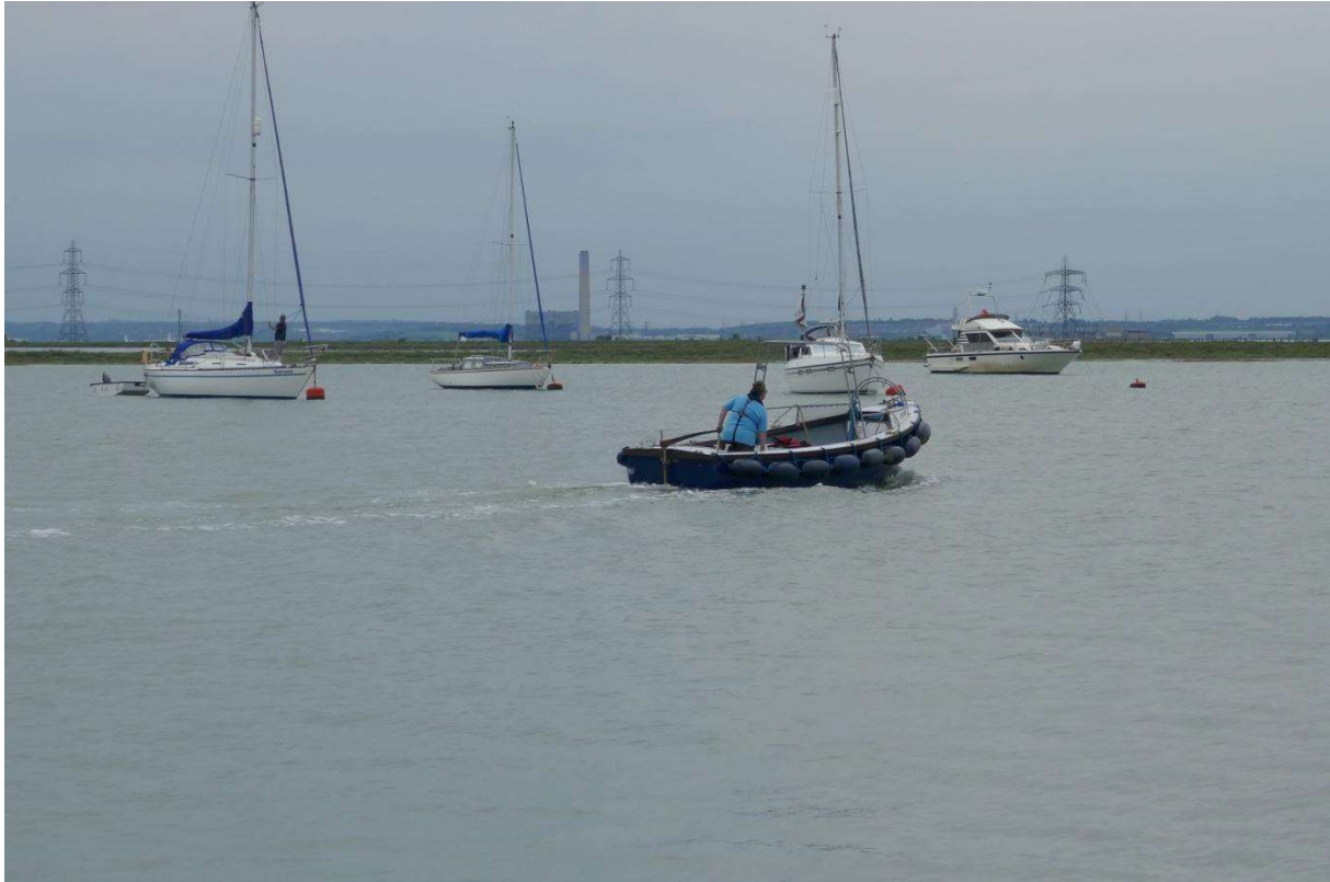
Quensborough, de havenmeester op weg naar een jacht om de bemanning naar de wal te brengen

Dat in Groot-Brittannië de regels en gewoontes op veel punten afwijken van die op het continent, hier steevast aangeduid als “Europe”, werd me snel duidelijk gemaakt. Eén van de zeilers die me geholpen had met het aanpakken van mijn lijnen sprak me aan met “mr. Dutchman” en wees me op de nummer-1-vlag die ik aan de achterstag had hangen, internationaal het teken dat je solozeiler bent. In Groot-Brittannië betekent het echter “I am a number one”, d.w.z. een wedstrijdzeiler van topklasse. Ik heb de vlag maar snel weggehaald. Na het avondeten ben ik naar de wal gelopen om een wandeling door het stadje te maken, maar om de sleutel te lenen ging ik eerst naar de pub. Daar was het een enorme drukte en herrie. De stoere mannen en feestelijk opgedirkte vrouwen die van hun pints stonden te genieten, deden hun uiterste best om het geluidsvolume van het bandje dat er speelde te overstemmen. Toen ik eindelijk aan de dame achter de bar kon vragen of ik de sleutel van het toiletgebouw kon lenen was het antwoord “no”. De pub ging de volgende morgen pas om 12 uur open en omdat ik dan al was vertrokken kon ik de sleutel niet teruggeven.