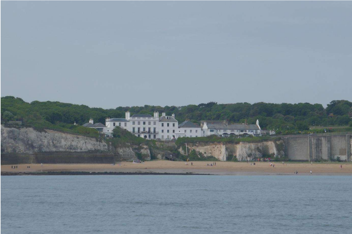
Een fraai stukje kust tussen Ramsgate en North Foreland

Om bij Quensborough te komen moest ik een stukje zuidwaarts varen, naar de monding van Swale, het water tussen Sheppey en het vasteland van Kent. Een echte haven heeft Quensborough niet, volgens mijn vaar-gids zou ik moeten aanmeren aan een “visitorsmooring” een aanmeerboei voor gasten, en kon ik via de marifoon of telefonisch een bootje oproepen dat me naar de wal zou brengen. Er was ook een ponton met een lange loopbrug naar de wal. Ik zag al van verre tientallen schepen aan meer-boeien liggen en wat later zag ik ook het ponton. Uit de Swale kwam net een vrij groot vrachtschip dat de hele breedte van de geul nodig had. Het was bijna hoogwater, uitwijken buiten de geul was geen enkel probleem. Nadat het schip was gepasseerd besloot ik eerst poolshoogte te nemen bij het ponton. Er liep een havenmeester die me zei dat ik moest vastma-ken aan een zeilboot die er lag aangemeerd. Toiletten of douches waren er niet, daarvoor moest je naar een toiletgebouwtje in het stadje. De sleutel kon je lenen bij de plaatselijke pub.