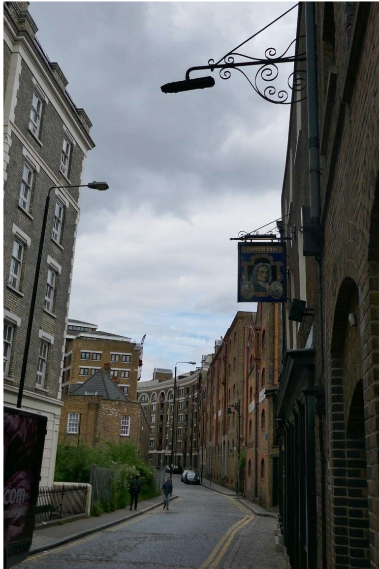
Straatje in de Docklands

waar prins Willem III woonde toen hij koning van Engeland was, vond ik dat geen probleem.