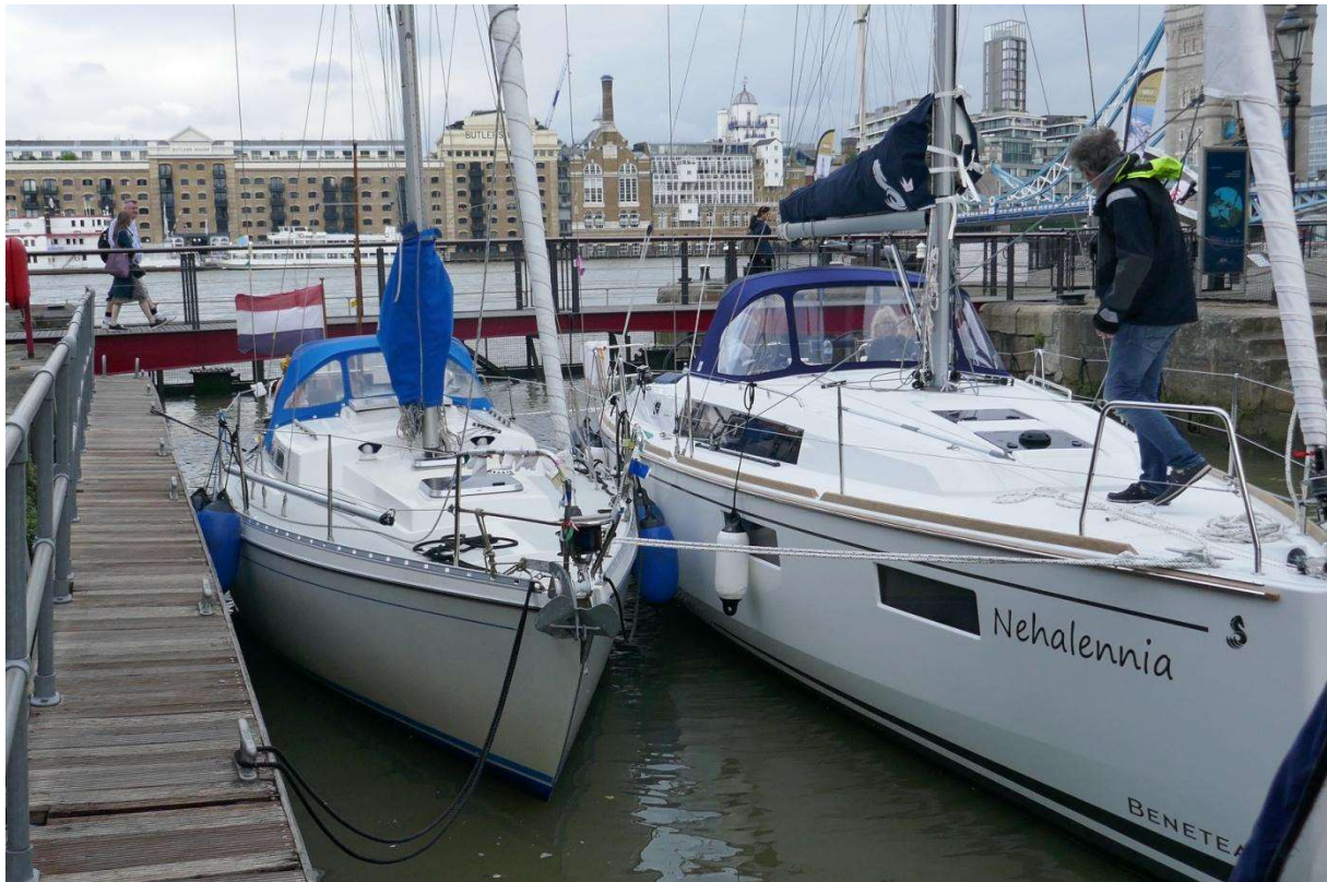
De twee Nehalennia's in de sluis van St. Katharine's Dock, het schutten kan eindelijk beginnen

In de sluis stond net zoveel deining als op de Thames, maar het lukte me gelukkig goed om mijn achter- en voorlijn snel om een bolder te gooien. De eigenaar van een Britse speedkruiser die voor me lag, stond op de wal met zijn handen in zijn zakken toe te kijken hoe ik aanlegde en complimenteerde me ermee, maar ik had liever gehad dat hij even mijn lijnen had aangepakt. Hoewel er aan de andere kant nog een plaats aan de wal vrij was, moest een wat groter Nederlands schip, dat toevallig ook Nehalennia heette, van de havenmeester aan mijn schip aanmeren. Mijn lijnen werden nu dubbel belast en toen er een flinke golf de sluis inrolde brak de achterlijn. Gelukkig had ik de voorlijn ook als spring gebruikt, waardoor het schip alleen wat met zijn neus naar wal draaide en het anker langs de stenen schraapte. Snel zette ik een andere lijn op de achterbolder. De sluisdeur ging dicht en ik begreep nu waarom het schutten zo traag ging. Het was hoogwater-springtij en daardoor was het water in de Thames zo hoog dat er voortdurend golven over de sluisdeur heen sloegen. Het water in de kolk moest zakken, maar dat lukte pas goed toen het water op de rivier omlaag ging. Pas om half vijf kon ik naar de mij toegewezen box varen.