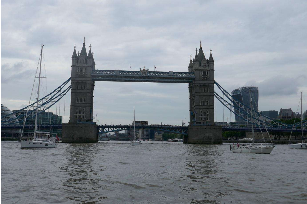
Een dik uur rondjes draaien voor de Tower Bridge, wachtend op de schutting

Vlak voor de Tower Bridge kon ik de sluis zien. Het was net kwart over drie geweest en hij werd van drie tot zeven uur bediend. Ik meldde me via de marifoon bij de havenmeester. Die zei dat ik even geduld moest hebben, eerst werden de uitgaande schepen geschut. Dat geduld werd behoorlijk op de proef gesteld. Omdat de Tower Bridge een belangrijke attractie is voeren er veel rondvaartboten en snelle ribboten rond die voor flinke golven zorgden. Samen met de zeven Nederlandse schepen en twee Britse jachten draaide ik voortdurend rondjes. Een paar maal moest een van de rondvaartboten en een veerboot een waarschuwingssignaal geven voor een jacht dat hen hinderde. Op een gegeven moment kwam er een politieboot die ons maande om aan de oever tegenover de sluis zo dicht mogelijk bij de wal te blijven, want er kwam een sleepboot aan met een lange sleep. Het schutten van de uitgaande schepen duurde zeker een uur en vlak voordat de sluisdeur openging kwam de politieboot weer waarschuwen dat we zover mogelijk aan de overzijde moesten blijven om de uit de sluis komende schepen niet te hinderen. Vervolgens werden we een voor een opgeroepen om de sluis binnen te varen. Zelf een plaatsje zoeken was er niet bij, de havenmeester zei waar we moesten liggen.