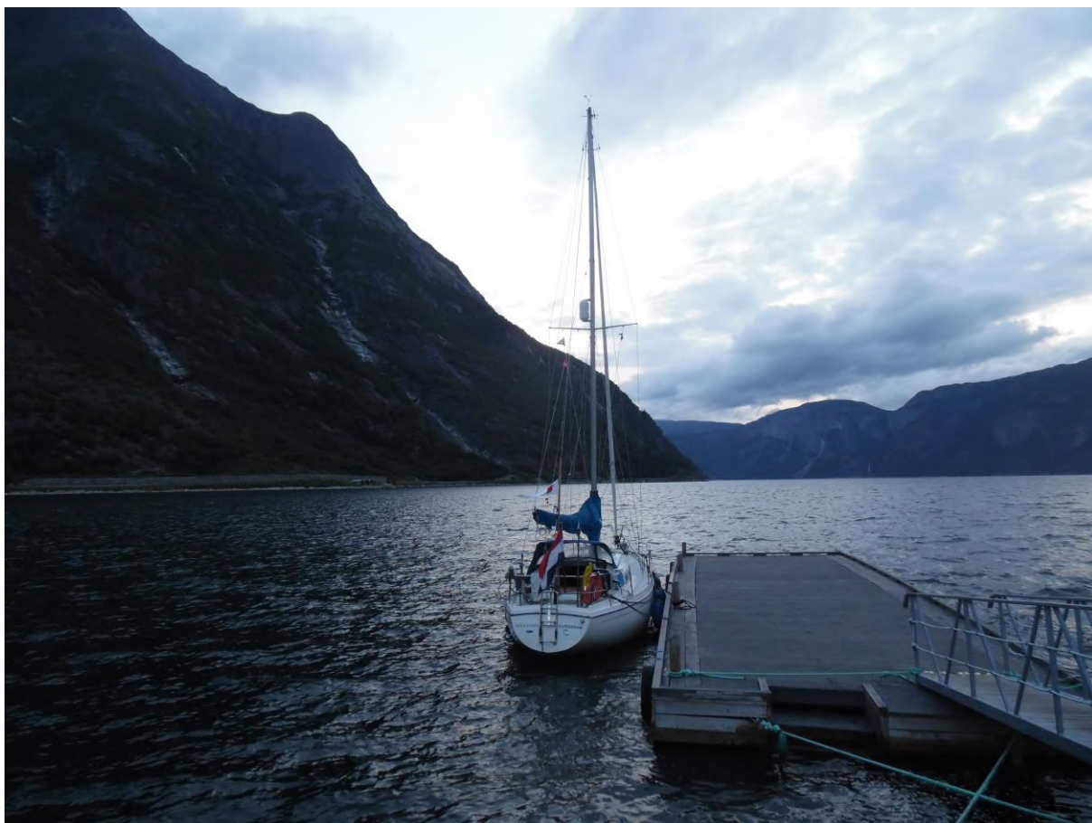
Aangemeerd aan het vlot in de Eidfjord.

stenige wal kwam. Omdat ik niet het risico wilde lopen om met mijn roer de stenige bodem te raken ben ik eerst gaan kijken hoe diep er was. Omdat het water in de fjord zeer helder was en ik de bodem niet kon zien, leek het me diep genoeg om zonder gevaar voor schade aan te meren. Dat bleek ook zo te zijn, de dieptemeter gaf aan dat het ongeveer 10 meter van de wal nog 21 meter diep was. De lijszijde van het vlot was uiteraard hogewal en aanleggen aan hogewal is lastig, zeker als je alleen bent er geen mens is die je lijnen kan aanpakken. Omdat het de aanleggers makkelijk te maken had men op het vlot twee paaltjes van een centimeter of veertig neergezet. Het lukte me prima om mijn voorlijn om een van de paaltjes te gooien, maar omdat het veel lager stond dan het schip en het rond en glad was en bovendien ook nog een beetje scheef stond, gleed de lijn ervan af. Ik probeerde het nog een keer en hield de lijn wat lager, maar weer gleed de lijn omhoog. Aan deze paaltjes had ik dus weinig en er zat niets anders op dan de met de punt van