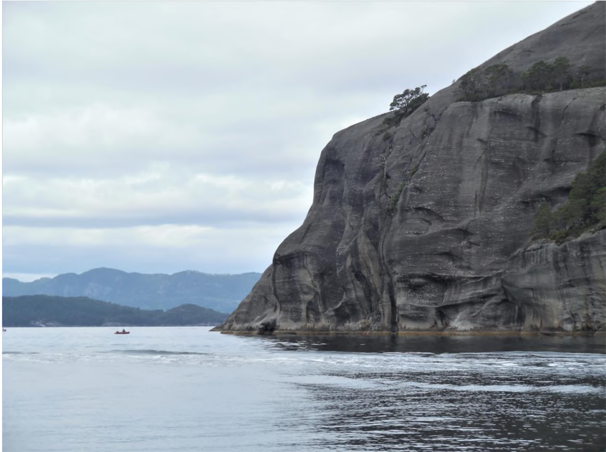
Gladgeslepen rotswand langs de Hardangerfjord tussen Husness en Jondal.

gen winden van alle richtingen, maar er kwam toch nogal wat deining de baai binnen. Ik had er weinig last van, maar het speedkruisertje dat naast me aan de andere kant van de steiger lag, rolde flink. Ik vroeg me af op de opvarenden nog wel aan rustig slapen zouden toekomen. Toen de zon onder was gegaan ging de wind gelukkig liggen.