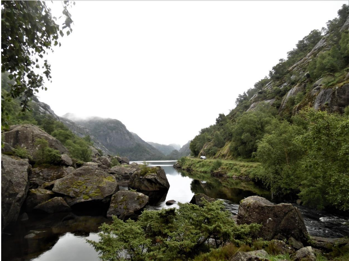
Natuurgebied achter Rekefjord.

aan weerskanten waren zeer imponerend, met vaak hoge, steile rots- wanden. Hier en daar stonden borden die waarschuwden voor vallend gesteente, maar hoe je je daar tegen zou kunnen wapenen is me niet duidelijk, een valhelm opzetten lijkt me vrij nutteloos. Het pad kwam na een kilometer of acht uit bij een oude ertsmijn die aan het eind van de 19 e eeuw was gesloten. In de bergen waren de hollen te zien van waaruit het erts was gedolven. Over het pad had vroeger een treintje gelopen dat het erts naar de Rekefjord transporteerde.