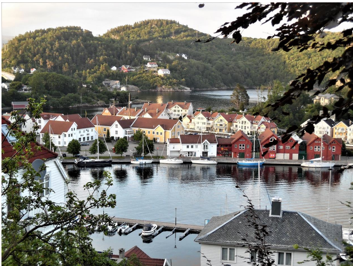
Farsund, uitzicht op de gastenkade. Links van het midden de Nehalennia.

rechterhand hield ik me vast aan de grootschoot. Het was een indrukwekkende ervaring, maar na een minuut of tien voer ik weer zeer relaxt tussen de scheren en even later zag ik de tegen een hoge heuvel aan geplakte witte huizen van Farsund al voor me. Op het ruime water voor de stad liet ik de stuurautomaat weer even het werk doen zodat ik rustig de stootwillen en lijnen op hun plaats kon hangen. Precies op het plekje waar ik verleden jaar op de terugreis ook had gelegen, legde ik met een voldaan gevoel aan. 's Avonds heb ik even een wandeling door het stadje gemaakt en vanaf de heuvel recht tegenover de boot heb ik genoten van het uitzicht op het scherengebied waar ik 's middags doorheen was gevaren.