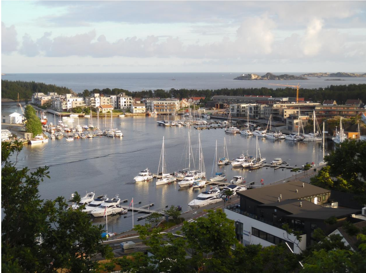
Mandal, uitzicht vanaf de Uraniënborg. Aan de kop van de steiger rechts van het midden ligt de Nehalennia.

Uranienborg heb ik het scherengebied en mijn boot vanaf grote hoogte bekeken.