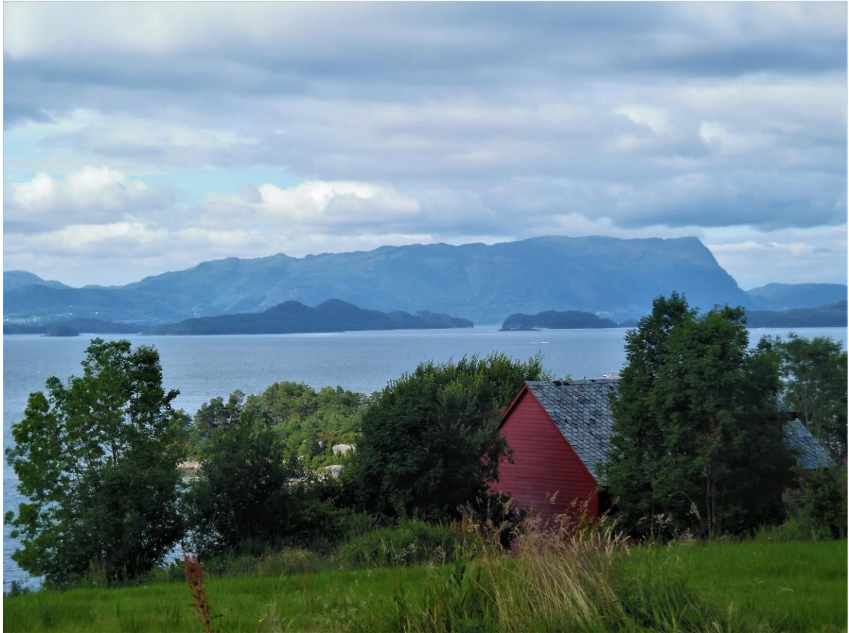
Langs de Hardangerfjord bij Husness.

steld, in het fietstochtje zat een klim in van 185 meter, maar ik werd beloond met een schitterend uitzicht over de zonovergoten fjord. Blijkbaar was mijn conditie nog niet zo slecht, ik kon iedere col op de pedalen nemen.