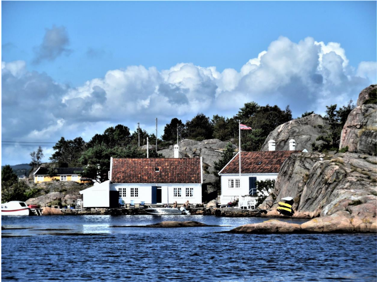
Eén van idyllische privéhaventjes tussen Kristianssand en Mandal.

De dag erop zag het er stukken beter uit. Ik kon weer lekker buiten in de zon ontbijten en erg hard woei het niet. Aan het eind van de morgen heb ik dan ook de lijnen weer losgegooid en ben ik naar Mandal gevaren, de zuidelijkste stad van Noorwegen. Hoewel ik vanwege de tegenwind het hele stuk op de motor moest varen, was het een schitterende tocht. Zo nu en dan voer ik door zeer nauwe doorgangen tussen idyllische eilandjes met schilderachtige witgeverfde houten vissershuisjes en daarna volgde er weer een stuk open water van waaraf ik een mooi uitzicht had op de heuvels en bergen aan de kust. De reis was daarom afwisselender dan die van twee dagen ervoor. Hoewel de schoolvakanties al waren begonnen en het wat drukker begon te worden, vond ik in de jachthaven van Mandal snel een plekje, met een schitterend uitzicht over de rivier en op de Uranienborg, een hoge heuvel met een uitkijkpunt. Na de maaltijd in de kuip heb ik nog even door het mooie stadje gewandeld en vanaf de