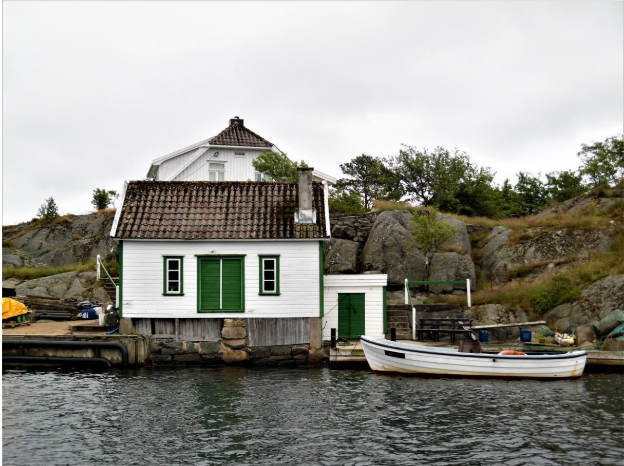
Vissersschuurtje langs de Blindleia.

op van de bekende Noorse schaatser Kos, uit de tijd dat Noorwegen en Nederland op schaatsgebied nog geduchte concurrenten waren. Die werd herkend, maar de conversatie verzandde al snel en mij een heel plezierig verblijf in Noorwegen wensend waggelde het groepje vrolijk verder. Naar bed gaan en proberen te slapen had geen enkele zin, maar om half één stopte de muziek en zocht ik mijn kooi op.