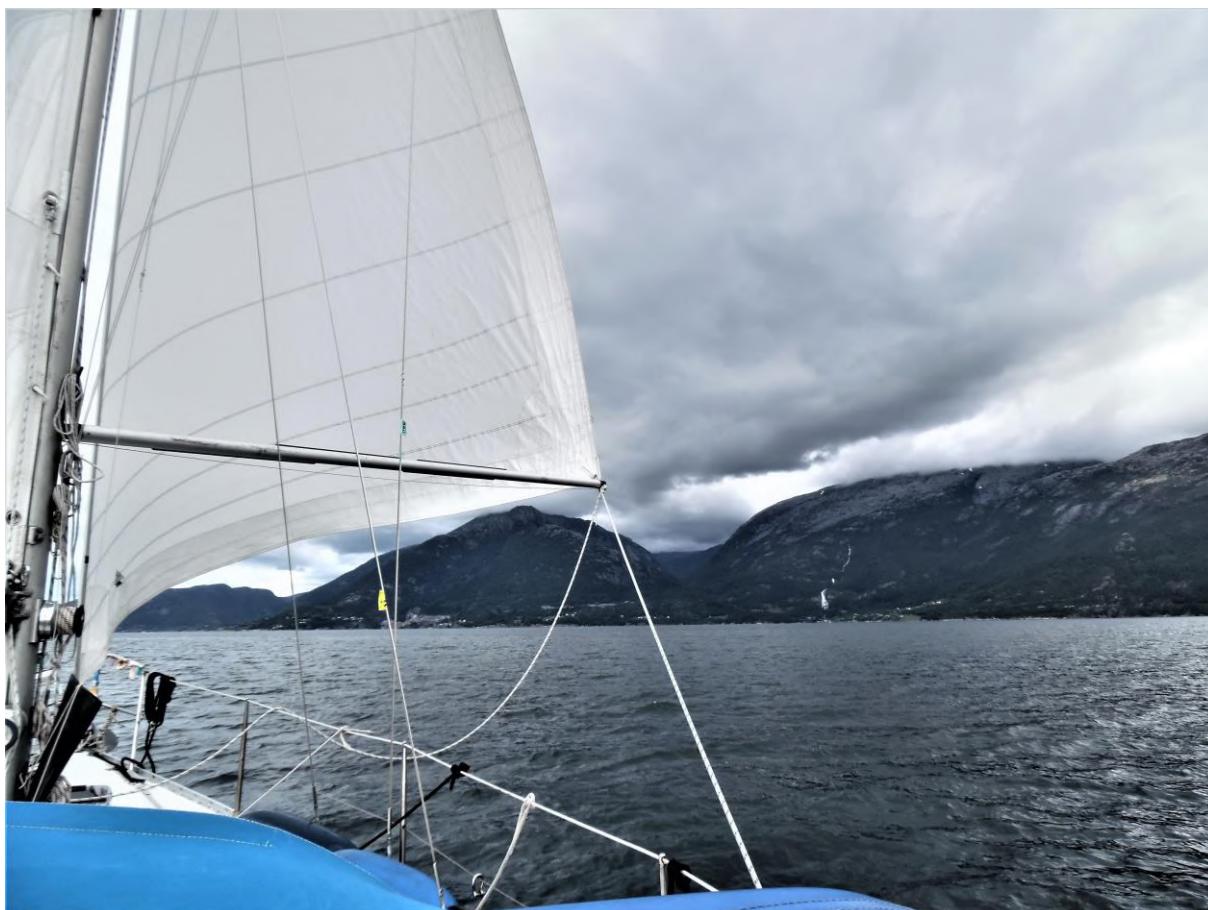
Voor de lap op weg naar Jondal.

een poosje heel hoog aan de wind zeilen en toen de koers wat noord-oost werd kon ik een tijdje halve wind zeilen maar daarna ging vrijwel alles voor de lap. Alleen als ik een eiland aan lij passeerde viel de wind even weg en kreeg ik hem soms even tegen. Ik wilde zoveel mogelijk van de gunstige wind profiteren en daarom zo ver mogelijk de fjord invaren. De Hardangerfjord heeft een aantal schitterende zijfjorden die ik ook graag wilde bezoeken, maar dat kon ik beter doen op de terugweg. Dan kon ik waarschijnlijk niet zulke lange stukken varen omdat ik de wind tegen zou hebben. Toen ik om een uur of vijf de ingang van de schitterende Maurangfjord passeerde, heb ik nog even overwogen om er te overnachten, maar ik besloot om door te varen naar Jondal, halverwege het begin en het eind van de Hardangerfjord. Vlak voor het plaatsje zwom er nog even een bruinvis bij de boot, voor de derde keer al tijdens deze reis.