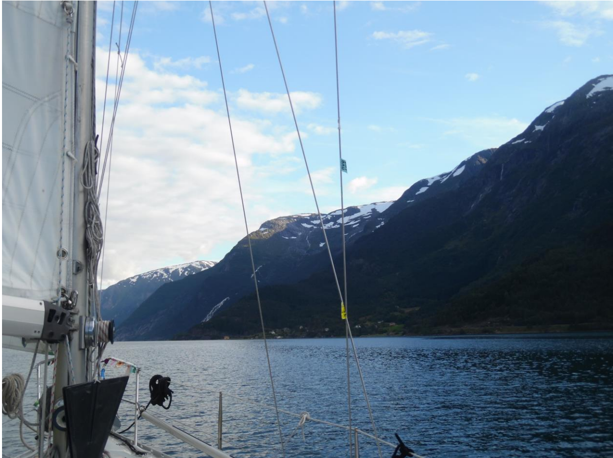
De Sörfjord met de besneeuwde toppen van het Hardangerplateau.

elk zeker honderd meter naar beneden. Het geluid van het vallende water was tot op het midden van de fjord te horen. Tegen de hellingen aan het begin van de fjord stonden opvallend veel fruitbomen, vaak overdekt door witte plasticfolie.