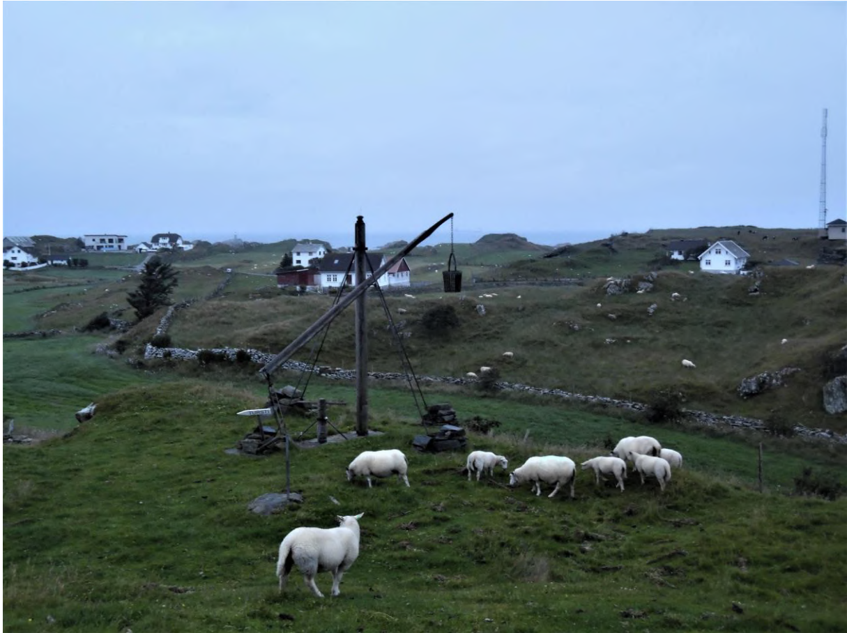
Kvitsoy, schapen bij een oude waterput.

op de kaart en ontdekte dat ik vlak voor de aanlegsteiger van de veerboot naar bakboord een geul had moeten invaren. Die liep naar de gastenhaven, midden in het dorp. Ik voer dus snel terug en na een minuut of tien was ik waar ik moest zijn.